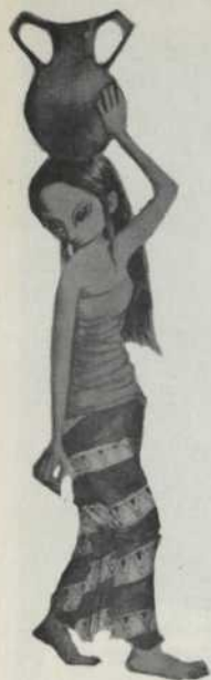
Pour Karaka, conte Indonésien Maquettes de Mirka Delanov Les marionnettes de Guy Beauregard