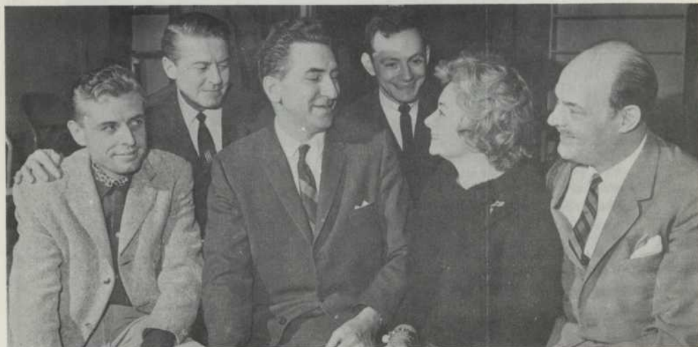
Les responsables de la saison artistique '64 Those responsible for the 1964 season

industrial design graphic design space planning/interior design