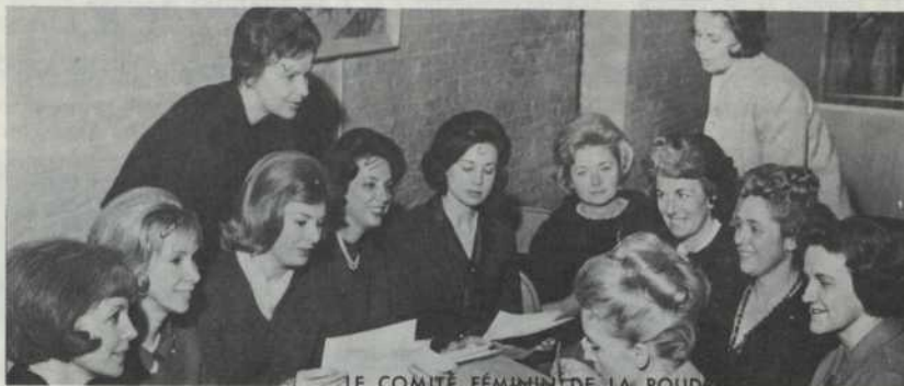
LE COMITÉ FÉMININ DE LA POUDRIÈRE

Le WINDSOR FACE AU CARRÉ DOMINION UN. 6-9611