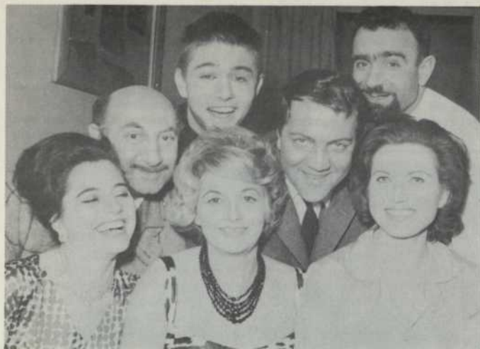
BUMERANG 1st GERMAN PRODUCTION OF 1963