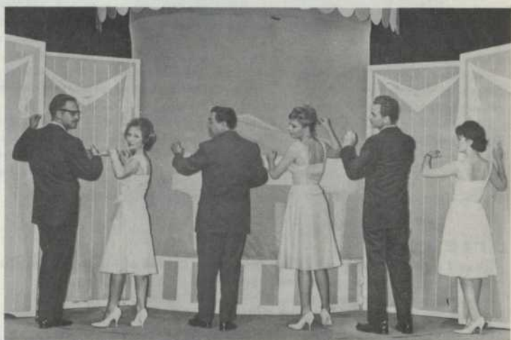
CAST OF THURBER CARNIVAL 1962