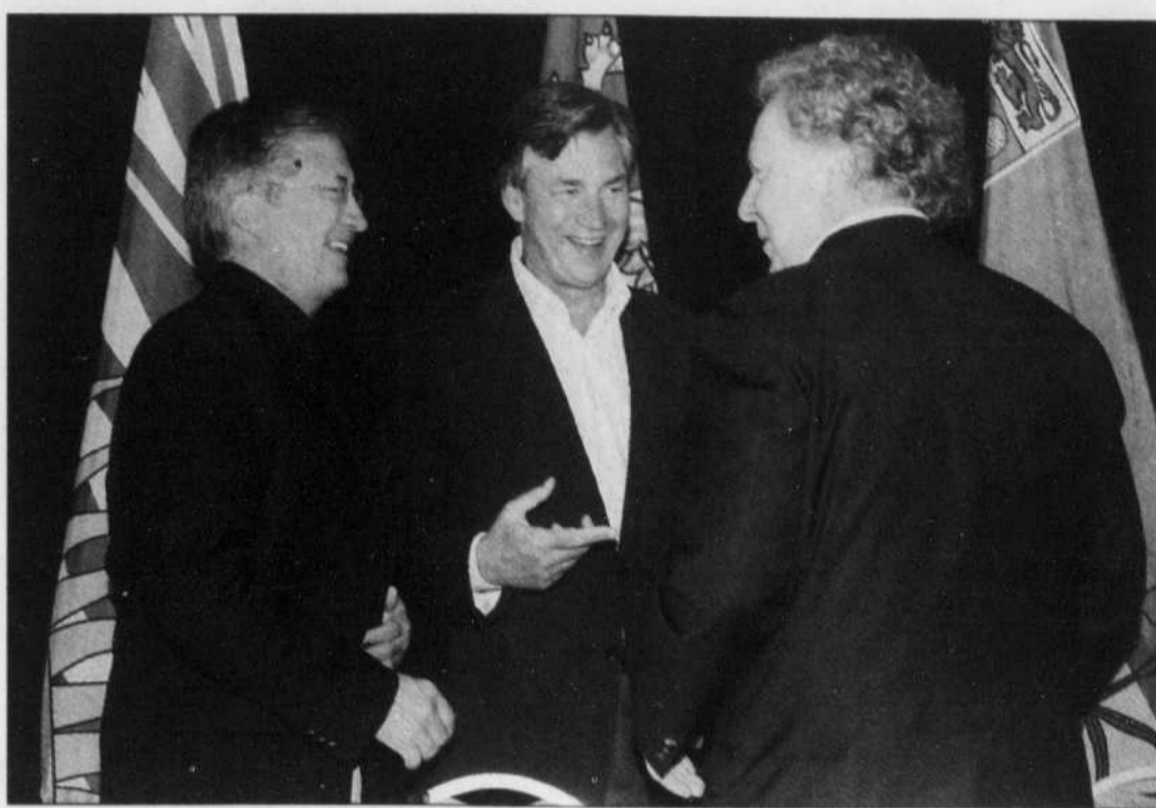
Le premier ministre terre-neuvien, Danny Williams, s'entretient avec ses vis-à-vis manitobain, Gary Doer, et québécois, Jean Charest, à l'issue de la rencontre du Conseil de la fédération, ces deux derniers jours, à St-John's, Terre-Neuve.

Confirmant ce désaccord, le Conseil de la fédération a émis, hier, un communiqué de presse qui omet toute référence aux relations fédérales-provinciales, au déséquilibre fiscal ou à la péréquation. Ce