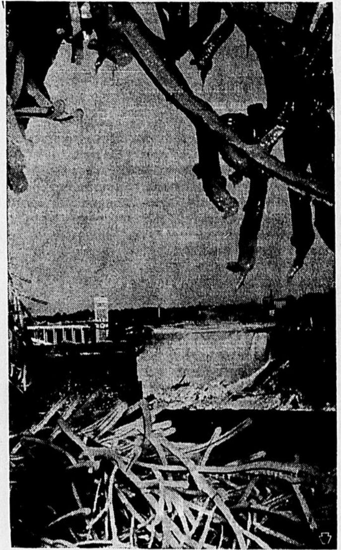
Niagara étincelant—Les chutes du Niagara pendant les mois d'hiver semblent avoir été spécialement conçues pour les photographes. Le gel des embruns sur les arbres voisins servent de toile de fond pour les chutes côté américain. Une documentation gratuite peut être obtenue auprès du Département INB des Chambres de Commerce de Niagara Falls, Canada ou de Niagara Falls, USA.

● Une seule bonne noix de coco contient autant de protéines qu'un quart de livre de bifteck, et un seul cocotier suffirait presque à nourrir un homme sa vie durant. Décrivant le cocotier, aussi appelé "arbre de vie". Sélection du Reader's Digest de janvier le compare à un supermarché aux douze récoltes et aux mille usages. On consomme chaque année dans le monde environ 25 milliards de noix de coco.