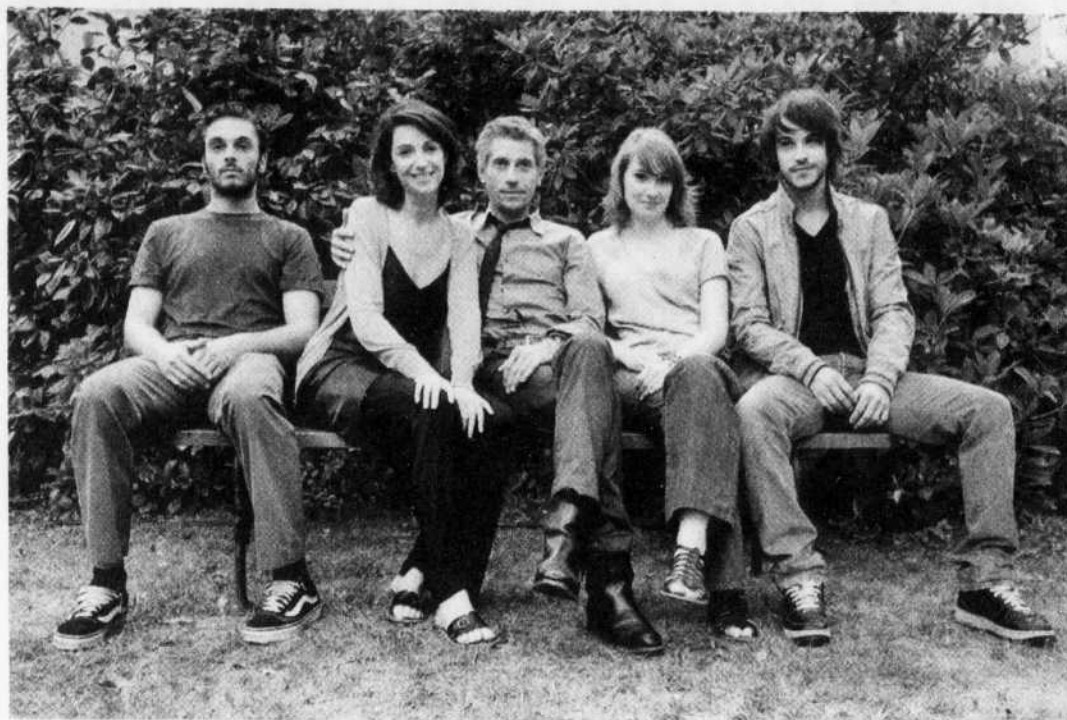
Les principaux comédiens du film Le Premier Jour du reste de ta vie