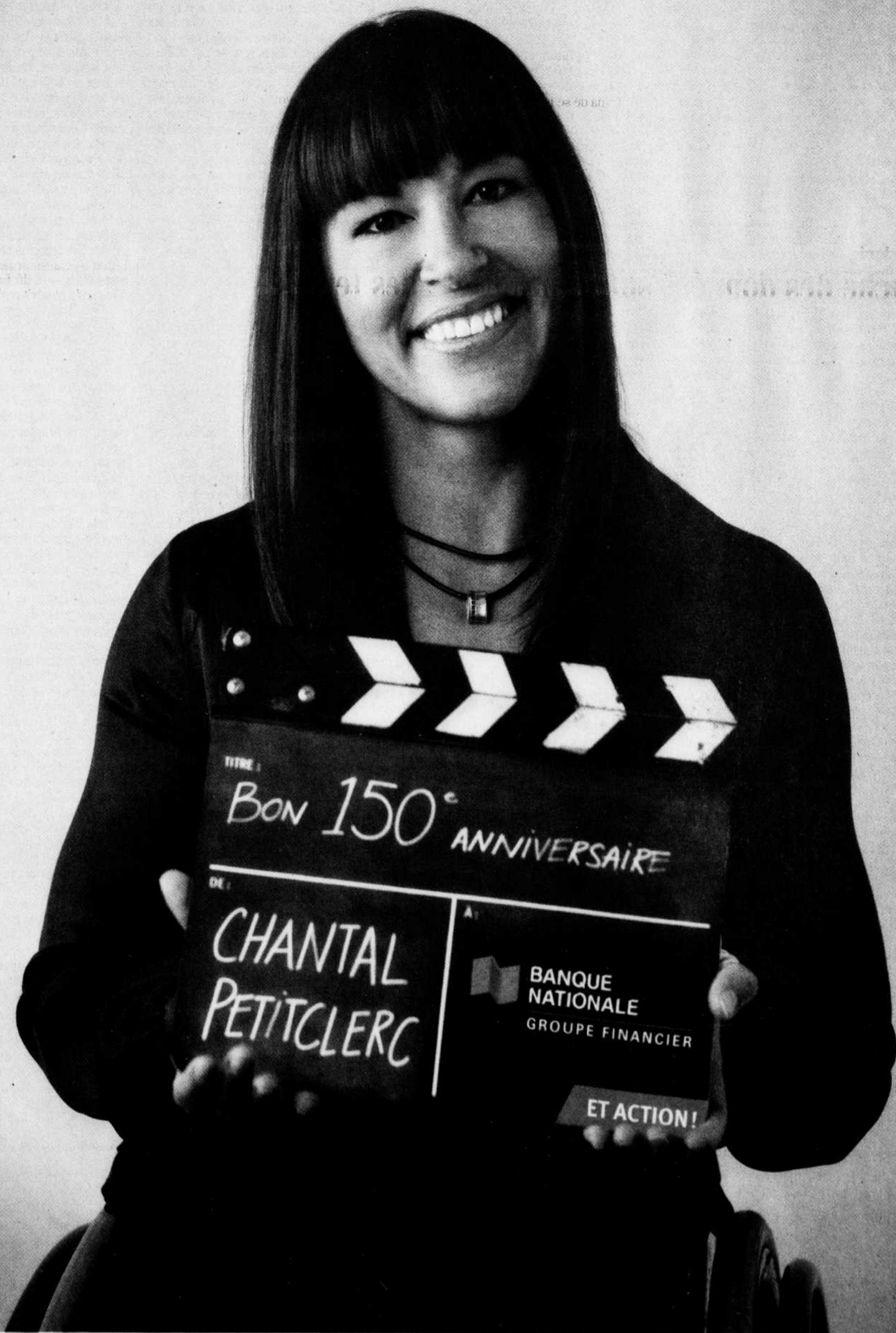
CHANTAL PETITCLERC Athlète paralympique