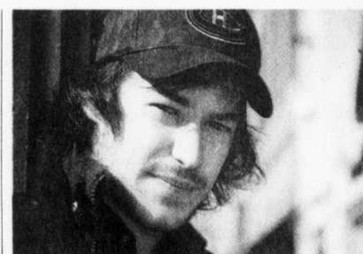
JEAN-FRANÇOIS LEBLANC LE DEVOIR

«Ce n'est pas à la jeunesse de changer le monde, nous avons tous cette obligation. Mais ils doivent se sentir obligés de faire partie du changement.»