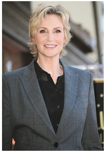
Coach dans Glee, Jane Lynch est plus populaire que jamais.

À la télévision, la comédie de situations Will and Grace , dans laquelle les deux personnages masculins principaux sont des hommes gays (Will le coïncé et Jack l'inénarrable), connut un énorme succès entre 1998 et 2006. Eric McCormack (Will) n'est pas gai, Sean Hayes (Jack), si. À la télé encore, l'acteur Neil Patrick Harris bénéficie d'une cote d'amour inébranlable dans le rôle d'un macho attachant, don juan invétéré, et hétéro, dans la série How I Met your Mother (2005), et ce, bien