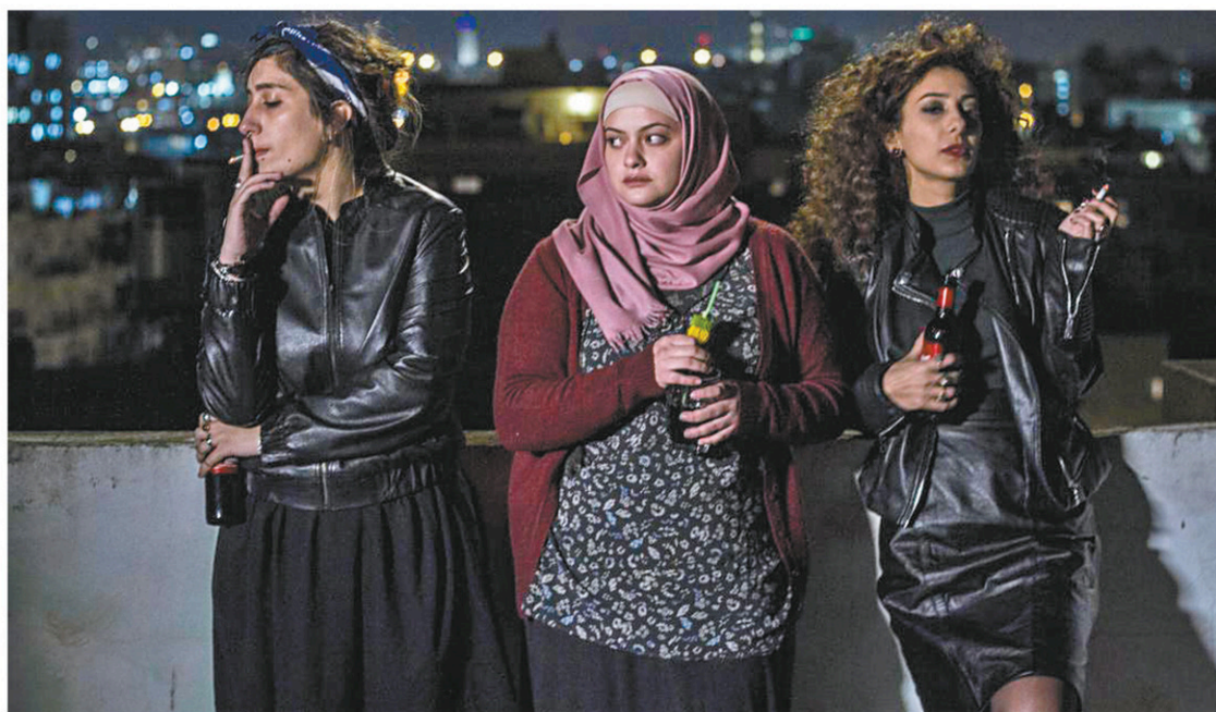
Une scène du film Je danserai si je veux , de Maysaloun Hamoud

sœurs qui se promènent aux États-Unis et qui font valoir leur point de vue par rapport au féminisme dans ce milieu-là», décrit Coppélia LaRoche-Francœur. Un sujet d'actualité, alors que le travail sous-payé et sous-valorisé des religieuses a été dénoncé au début du mois dans une publication du Vatican.