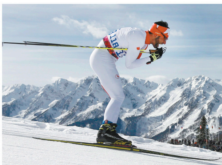
Brian McKeever a remporté 10 médailles d'or aux Jeux paralympiques depuis ses débuts en 2002 à Salt Lake City.

« La mentalité d'athlète signifie peut-être que je vais essayer de rattraper les équipes devant moi », a lancé McKeever en riant. « J'imagine qu'il y aura des gens pour me garder en