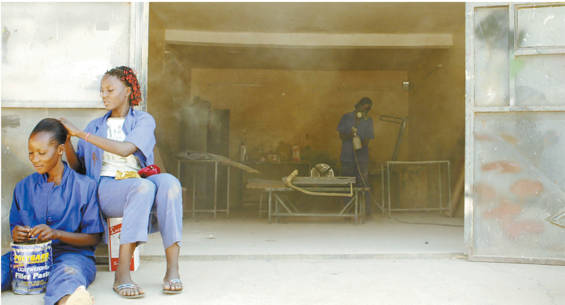
Une scène du documentaire Ouaga Girls , de Theresa Traore Dahlberg

CAHIER B > LE DEVOIR, LE VENDREDI 9 MARS 2018