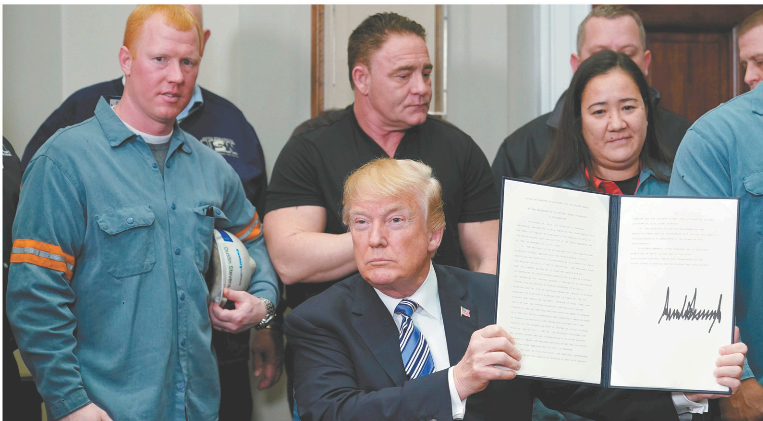
Le président américain montrant la proclamation instaurant des tarifs sur les importations d'aluminium signée