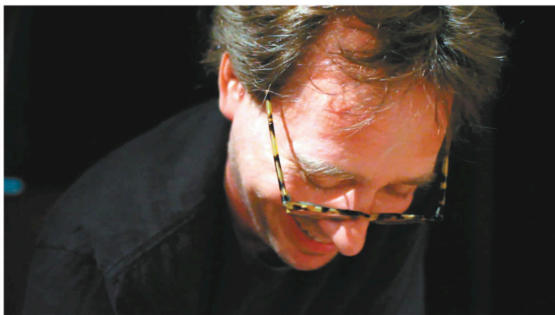
Amalric et le compositeur John Zorn (ci-dessus) sont amis depuis une dizaine d'années.

Ses trois récents films sur Barbara Hannigan, ainsi que celui sur son ami John Zorn, ont en commun la candeur du regard qu'il porte sur ces musiciens au travail. « Je trouve que les gens sont beaux au travail, surtout les musiciens, les gens que j'admire le plus au monde. Pourquoi? Parce que, en regardant Zorn et Barbara [Hannigan] travailler, on reconnaît quelque chose de l'athlète, donc de la précision, de l'exercice. C'est être sans cesse dans la répétition, chauffer son instrument, être performant, et avec ça trouver quelque chose qui touche à l'âme, qui évoque la spiritualité. » Dans le regard d'Amalric se découvre même un lien entre John Zorn, jazzman de l'avant-garde, et la soprano Barbara Hannigan « par leur manière de se mettre en danger, de cher-