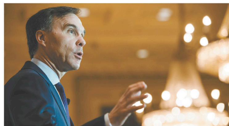
Le ministre Morneau avait annoncé en décembre des modifications à sa controversée réforme fiscale. Ces mesures sont entrées en vigueur le 1 er janvier.

Le ministre Morneau avait annoncé en décembre des modifications à sa controversée réforme fiscale qui visaient