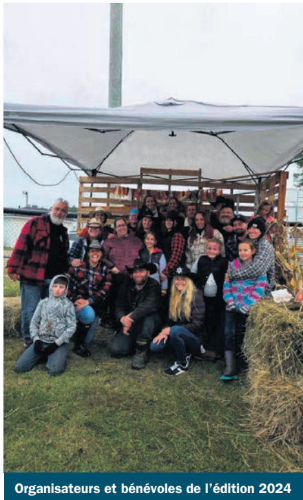
Organisateurs et bénévoles de l'édition 2024

Au programme de cette journée enrichissante : expositions et démonstrations, animaux de la ferme et exposants, rencontres avec les producteurs, activités pour toute la famille, spectacle de clôture avec Eldorado de Fred Dionne à 20 h et c'est gratuit!