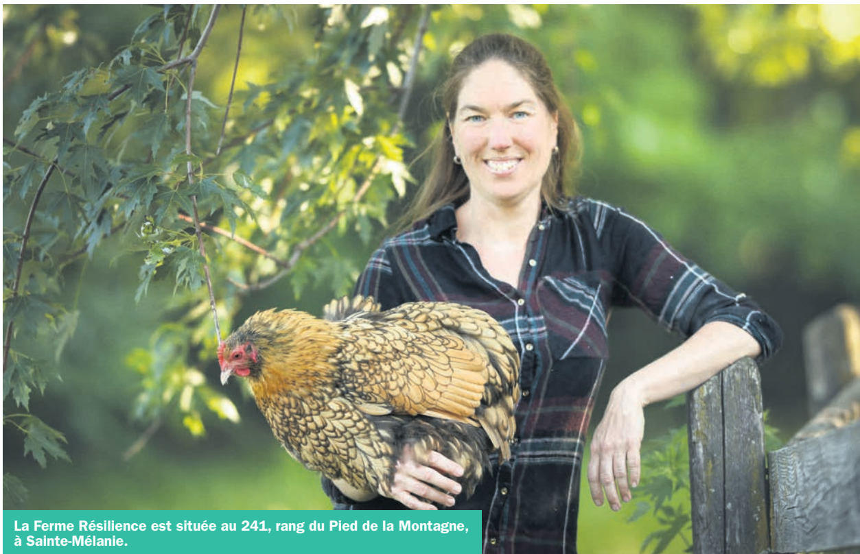
La Ferme Résilience est située au 241, rang du Pied de la Montagne, à Sainte-Mélanie.

« J'avais approché le CRE Lanaudière et suggéré de faire le projet à la ferme! Ils ont accepté et nous avons pu bonifier