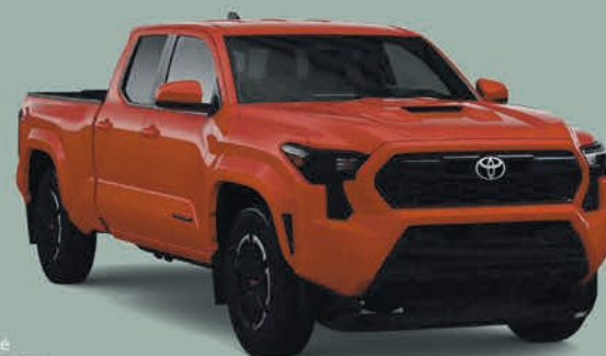
Véhicule présenté 2025 Tacoma, Double Cab Regular Bed TRD Sport