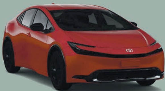
Véhicule présenté 2025 Prius Plug-in, SE