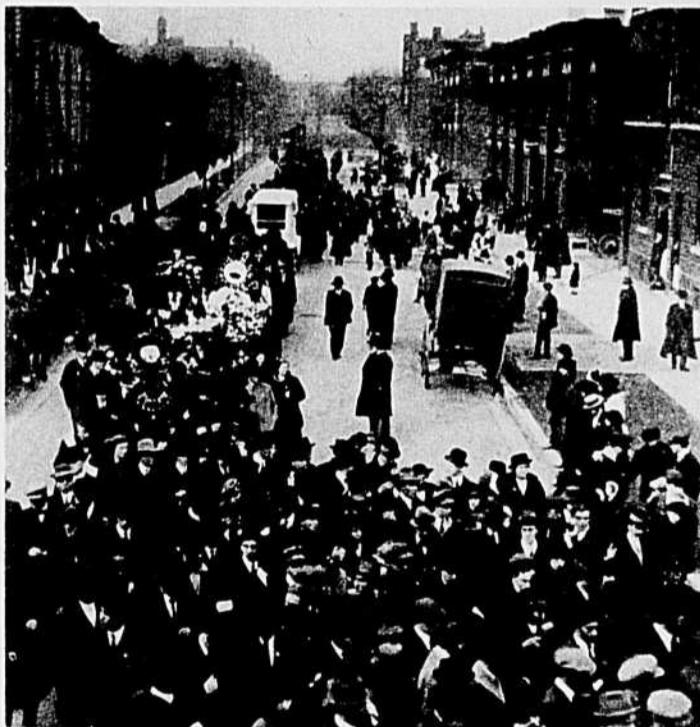
Photo du défilé aux funérailles. On peut voir le long cortège de fleurs et de couronnes mortuaires.

Pour permettre à tous les travailleurs qui désirent assister à la pièce de respecter leur budget, les billets seront vendus à prix populaire (de $1.50 à $3.00).