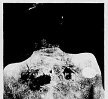
Le corps de Joe Hill avant son incinération.