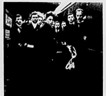
Les porteurs étaient de toutes nationalités.