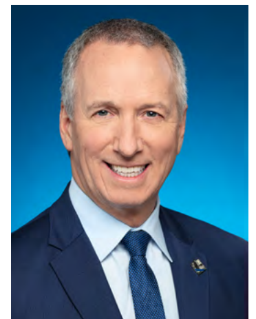
Le ministre de l'Agriculture, des Pêcheries et de l'Alimentation