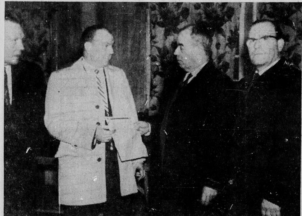
L'ARENA EST TOUT PAYE — Les résidents de Mattawa se réjouissent de ce que leur arena est maintenant payé en entier. Au cours du carnaval d'hiver qui a eu lieu en fin de semaine dernière, on a brûlé l'hypothèque, libérant ainsi la population de toute dette.

C'est facile, c'est profitable de placer une annonce classée dans les pages de "l'Édition du Nord".