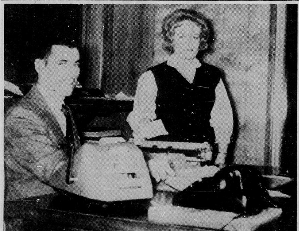
AU SERVICE DU PUBLIC — La Caisse populaire de Hanmer compte sur un personnel qualifié qui saura faire bon accueil aux