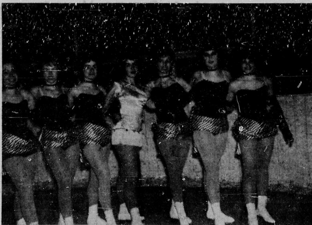
AU CARNAVAL DE MATTAWA — Six charmantes patineuses ont été applaudies lors du carnaval d'hiver qui a eu lieu à Mattawa, en fin de semaine. Ces artistes du patinage de fantaisie sont, de gauche à droite, Mlles

La soirée s'est terminée par un programme récréatif et une danse.