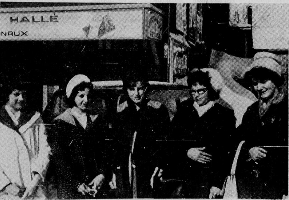
AU DEPART — On voit ici cinq jeunes élèves de l'école secondaire De La Salle de Témiscaming, lors de leur départ pour une visite à Ville-Marie, où elles ont eu l'occasion de visiter le Palais de Justice de l'endroit ainsi que d'autres institutions telles la ferme et l'école d'agriculture Moffette.