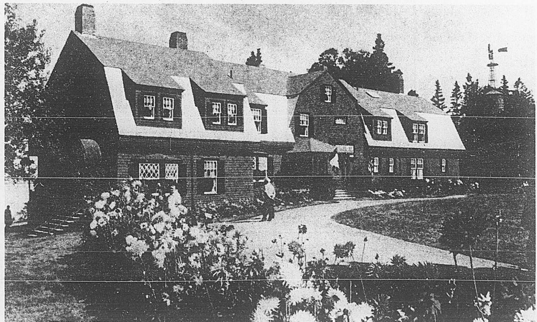
C'est ici que la famille du président F.D. Roosevelt passait ses étés. La résidence est en sol canadien, mais fait partie d'un parc international aménagé dans l'île Campobello, une des trois îles de Fundy au large du littoral sud-ouest de la province pittoresque, le Nouveau-Brunswick.

Une armoire qui provient de la résidence des Roosevelt à Hyde Park dans l'état de New York, contient des objets de la collection de livres miniatures de F.D.R. Il y a aussi plusieurs assiettes du service de vaisselles utilisé à la Maison Blanche pendant qu'elle était occupée par F.D.R. Selon la coutume, chaque président peut choisir son propre motif et dans ce cas particulier c'est celui qu'on appelle le Mount Vernon. En l'examinant de près, vous découvrirez dans le motif une reproduction de la résidence de George Washington à Mount Vernon en Virginie. Un