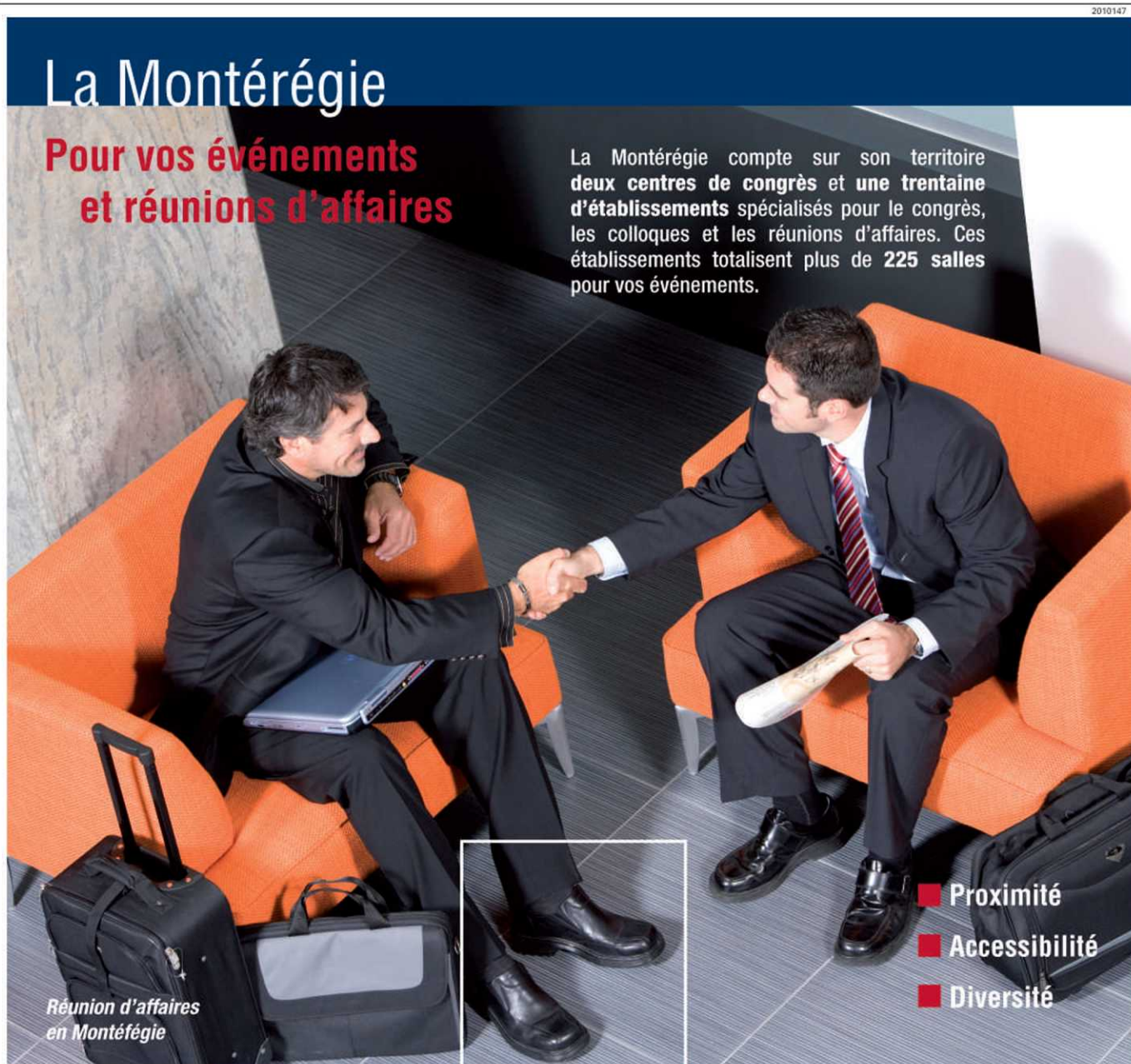
Réunion d'affaires en Montérégie

La Montérégie compte sur son territoire deux centres de congrès et une trentaine d'établissements spécialisés pour le congrès, les colloques et les réunions d'affaires. Ces établissements totalisent plus de 225 salles pour vos événements.