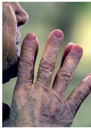
La gérontologie est l'un des programmes les plus populaires en session d'été à l'Université de Montréal.

Celui consacré à la petite enfance et à la famille s'adresse aux éducatrices en petite enfance, aux conseillères pédagogiques et aux intervenantes psychosociales et il répond aux besoins de formation des intervenantes qui