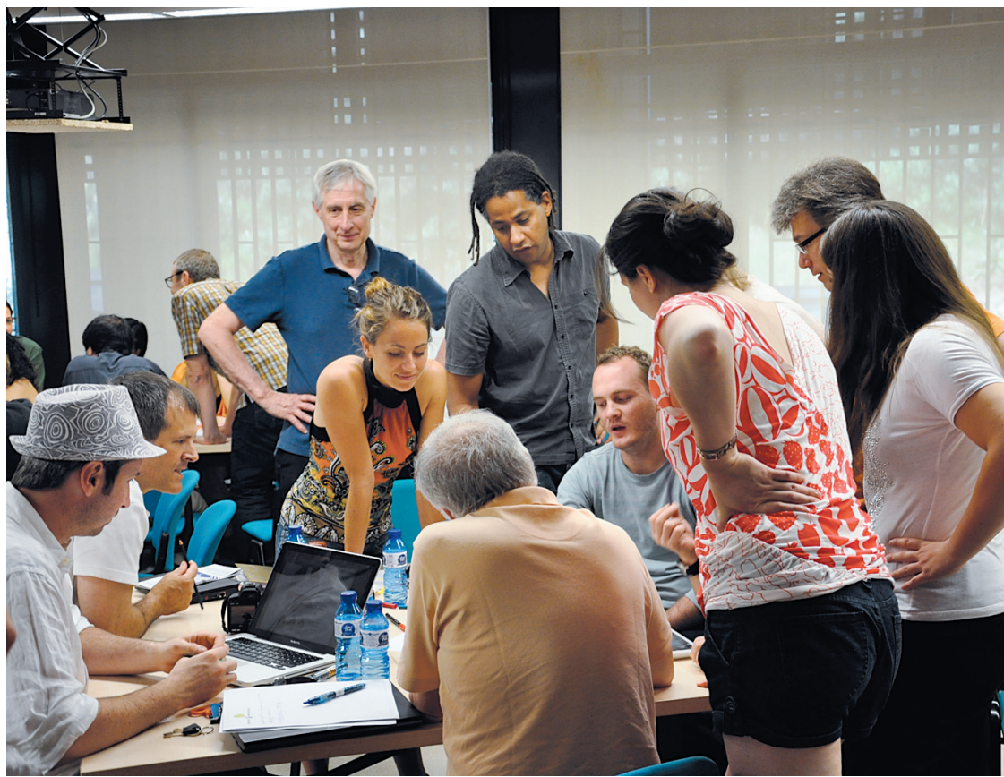
Atelier de codesign à l'Université de Barcelone

Les participants sont ainsi invités à visiter des entreprises innovantes et des orga-