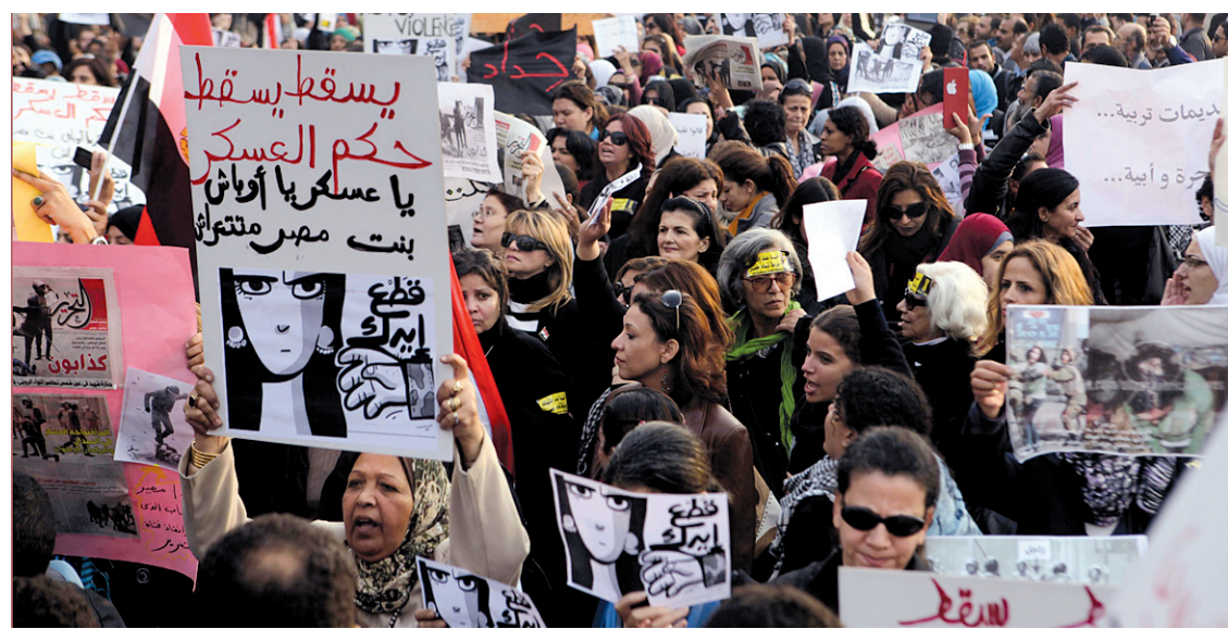
Le Printemps arabe sera l'un des sujets à l'ordre du jour de l'école d'été sur les terrorismes de l'Université Laval.