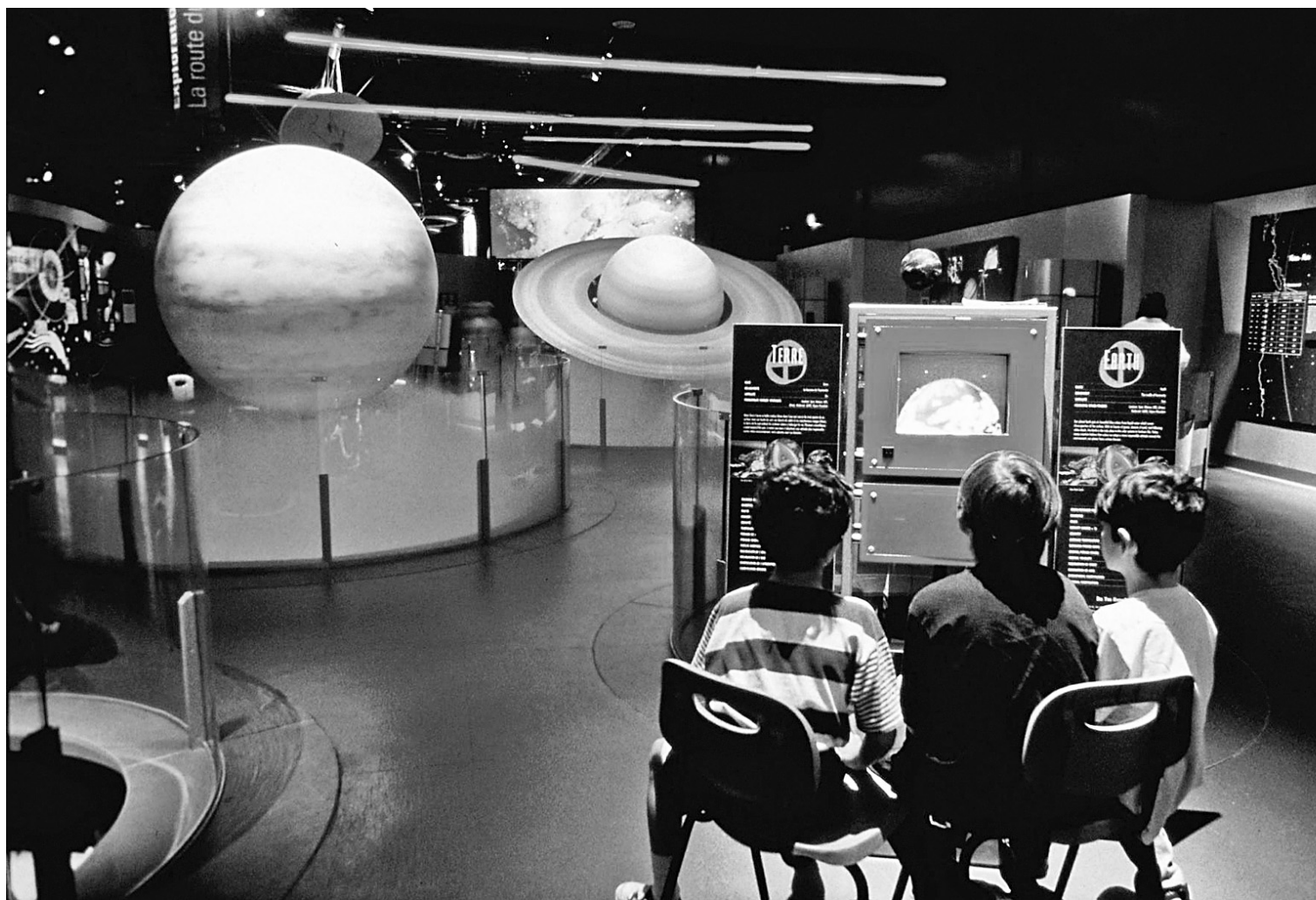
À Laval, le Cosmodôme propose aux jeunes de 9 à 15 ans de jouer aux astronautes, une expérience qu'ils ne sont pas près d'oublier!

Le camp CAMMAC existe depuis 60 ans, ce qui fait de lui