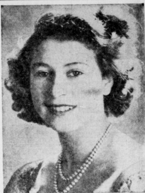
Elle a 21 ans — L'héritière présomptive du trône de Grande-Bretagne a 21 ans aujourd'hui, mais l'événement passe presque inaperçu dans son pays natal, puisqu'en compagnie de son père, de sa mère et de sa sœur, elle est à des milliers de milles, en Afrique du Sud, où il a de grandes fêtes.

Le roi de l'étais est mort BUENOS AIRES, 21. (P. A.) — Simon-Patino, surnommé le ROI DE L'ETAIN, archi-millionnaire de la Bolivie, est mort à son appartement du Rila, ici hier. On a déjà estimé la fortune de Patino à $300,000,000. Au commencement de la dernière Grande Guerre, quand il dut quitter ses palais de la Riviera, il séjourna quelques temps à New-York et à Montréal. Patino aurait 86 ans, mais sa biographie officielle n'en indique que 61.