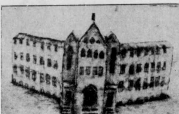
Orphelinat en neige — Cette miniature de l'édifice futur de l'orphelinat St-Joseph de Waterville, telle que conçue par l'architecte, a été construite en neige par des garçons de 13 et 14 ans qui fréquentent l'institution, vers la fin du mois de mars dernier.