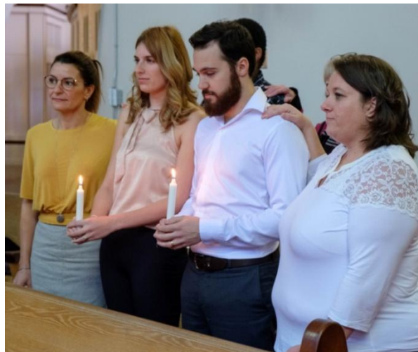
La confirmation des adultes se vit dans une atmosphère familiale et communautaire, avec le soutien spirituel d’un parrain ou d’une marraine de confirmation. L’approche catéchuménale implique une préparation qui se déploie dans le temps.

Avec une assemblée d’une soixantaine de personnes, la célébration de la confirmation s’est tenue à