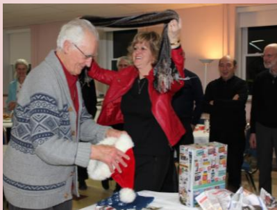
Souvenirs du fraternel souper des Fêtes partagé avec le personnel pastoral diocésain.