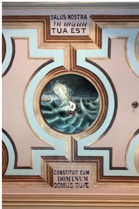
La richesse picturale de plusieurs églises est propice à un partage faisant appel à la symbolique religieuse et artistique.

À l'occasion d'une autre rencontre, un confirmand raconte que lors du décès de son grand-père, il a pris conscience de l'importance de sa famille. Cette famille il s'en était éloigné, heureux de voler enfin de ses propres ailes. Ce décès, l'a questionné et lui a fait prendre conscience de ce qui l'a construit et qu'il ne pouvait pas s'en détacher avec désinvolture. «Pour représenter ça, j'ai choisi la