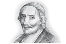
François de Laval (10)