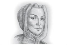
Marguerite D'Youville (16)