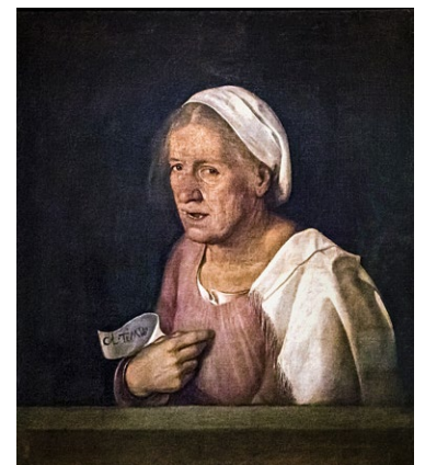
L'AVARICE | ALBRECHT DÜRER

La bonté naturelle de l'être humain est un ancien postulat qui fera l'objet de critiques assassines dans l'œuvre de certains des auteurs les plus influents – et controversés – de l'époque, comme Nicolas Machiavel, Thomas Hobbes ou Jean Bodin. Pour le premier, fonctionnaire de la République de Florence et singulièrement associé à une conception du pouvoir qui lui est éponyme, l'humain tel que présenté dans Le Prince est un être faible, avare et victime de ses passions. Un bon souverain, précise-t-il, n'hésitera donc pas à recourir à la ruse et à user de stratagèmes pour conserver son domaine. L'impassible pragmatisme de l'auteur florentin renvoie à un adage bien connu : la fin justifie les moyens.