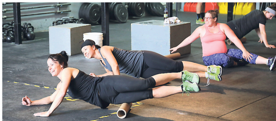
Chaque entraînement commence par un réchauffement de type « Agile 8 », afin de bien préparer le corps.

« C'est plus ça le type de clientèle qui nous intéresse. On change vraiment leur vie », s'émerveille le cofondateur de l'entreprise de Saint-Alphonse.