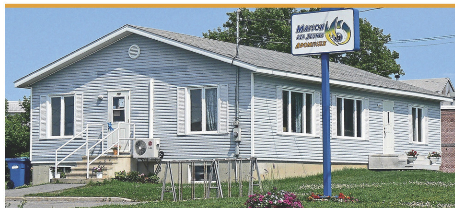
La maison des jeunes l'Adomissile est située au 100, rue de la Gare, à Saint-Rémi.

«Je suis fière de l'implication et de la synergie des acteurs de notre région dans ce projet, souligne la députée de Huntingdon, Claire Isabelle. C'est une bonne nouvelle pour l'environnement ainsi que pour la vitalité de notre territoire. En travaillant en étroite collaboration, en partageant les bonnes pratiques, on peut parvenir à de grandes réalisations qui seront bénéfiques pour l'ensemble de la communauté.»