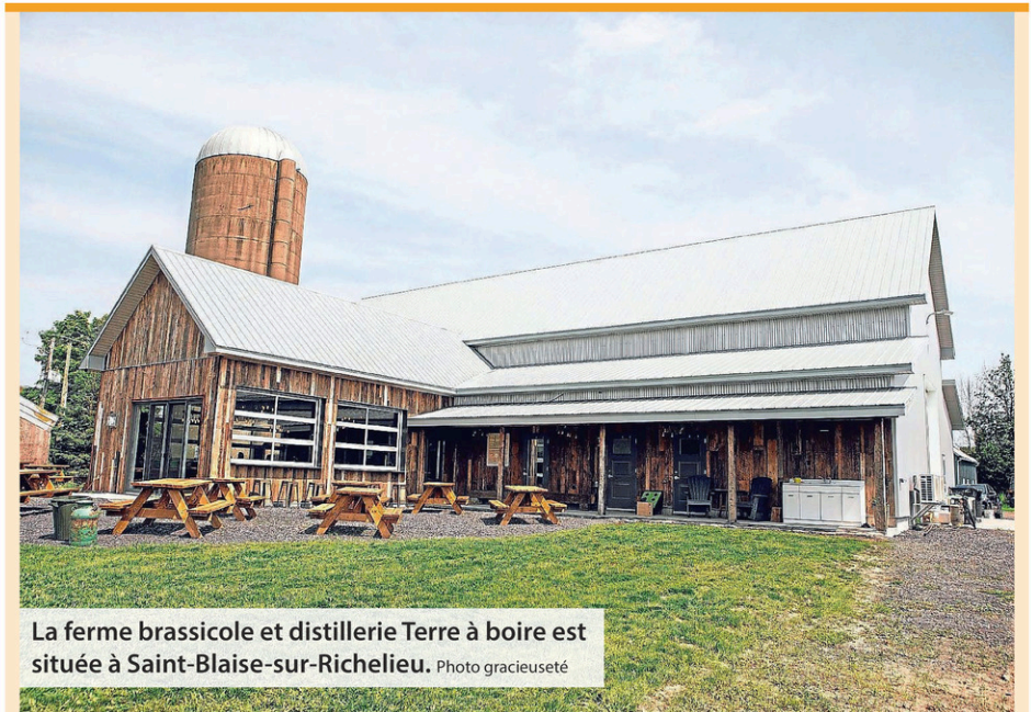
La ferme brassicole et distillerie Terre à boire est située à Saint-Blaise-sur-Richelieu.