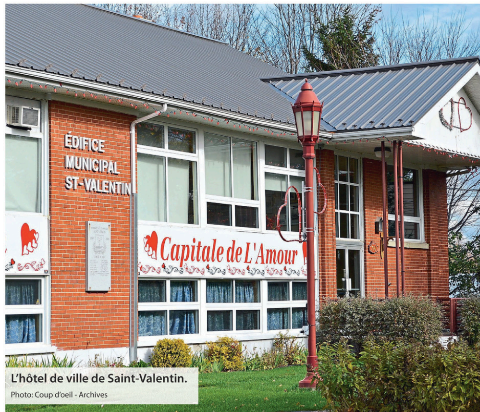
L'hôtel de ville de Saint-Valentin.

Elle s'est produite sous la direction des chefs Yannick Nézet-Séguin (Orchestre Métropolitain) et Oko Matsuo, qui dirige l'Orchestre symphonique de Tokyo.