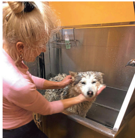
Harlem se fait toiletter par la mère de M. Firetto, peu après l'avoir reçue chez elle, à Lyon, en France.

comme les maisons de haute couture. On connaît leur travail et leur approche.»