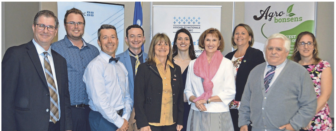
Des élus, des membres du CLD et des agriculteurs qui participent à l'initiative Agrobonsens du Pôle d'excellence en lutte intégrée, lors de l'annonce de l'aide financière de 300 000 $ versée par le MAPAQ.

«Les agriculteurs sont depuis toujours des acteurs de changement en ce qui concerne l'agroenvironnement, au gré de l'évolution des