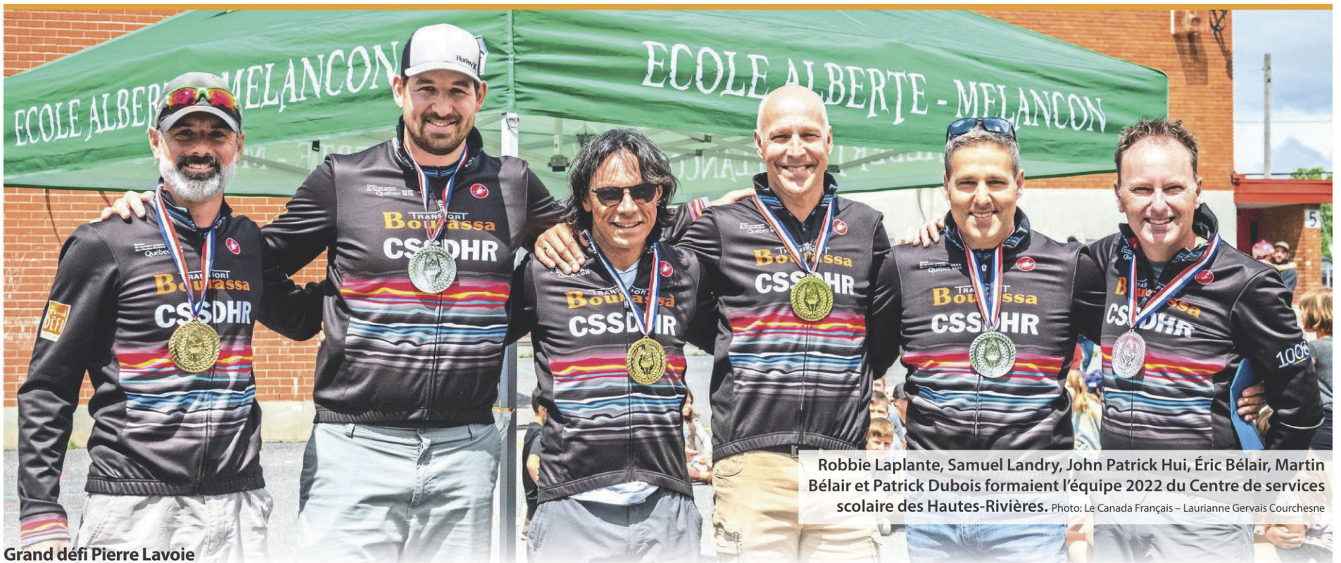
Grand défi Pierre Lavoie