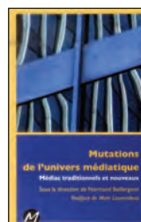
Normand BAILLARGEON (dir.), Mutations de l'univers médiatique : médias traditionnels et nouveaux , M Éditeur, Mont-Royal, 2014, 152 pages.

Dans Une histoire philosophique de la pédagogie , Baillargeon retrace, de manière très simple, les grands enjeux philosophiques à l'origine des systèmes d'éducation. Un outil incontournable pour poursuivre la réflexion sur l'école que nous voulons.