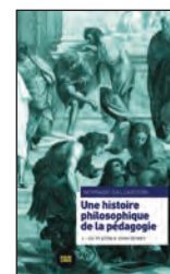
Normand BAILLARGEON, Une histoire philosophique de la pédagogie. Tome I – De Platon à Dewey , Éditions Poètes de Brousses, 2015, 224 pages.