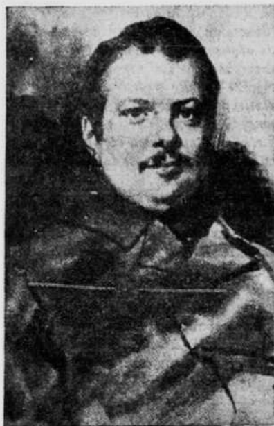
Honoré de BALZAC par Boulanger