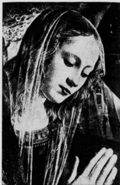
TÊTE DE LA VIERGE

Ce petit ouvrage, écrit en collaboration, contient l'essentiel de douze leçons professées, dans un cours public de mariologie, par