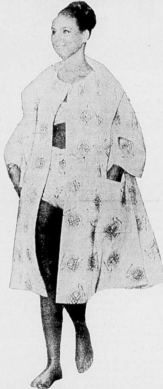
SHE DREAM'T SHE WAS WALKING on the beach in her union label bathing suit. That's what happened recently to this beautiful union label model at the presentation of the ILGWU's National Collection. Always check for the union label yourself when buying garments, even if that's not always as easy as it looks on this photo. It's a guaranty of elegance and quality.