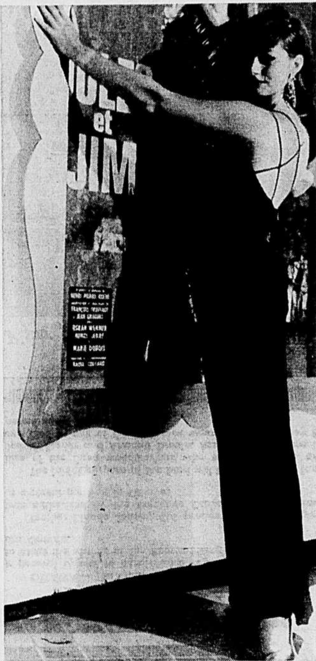
IL N'Y A PLUS RIEN DE TROP BEAU pour les travailleurs. En dépit des apparences, nous ne vous faisons pas assister à la première du film "Jules et Jim" à Paris. Il s'agit bel et bien d'une robe du soir conçue par des dessinateurs canadiens, exécutée par de petites Midinettes bien de chez nous et présentée dans le cadre de la collection nationale de l'UIOVD. Et elle porte l'étiquette syndicale quelque part. Cherchez la femme, bien sûr, mais n'oubliez pas de chercher en même temps l'étiquette syndicale...