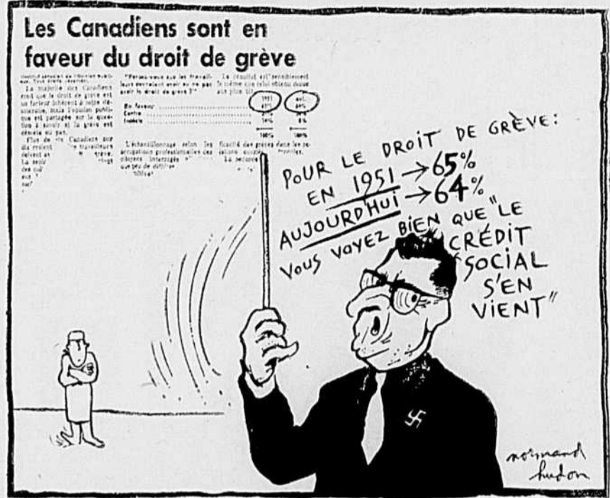
Si jamais Caouette arrive, le droit de grève fout le camp!