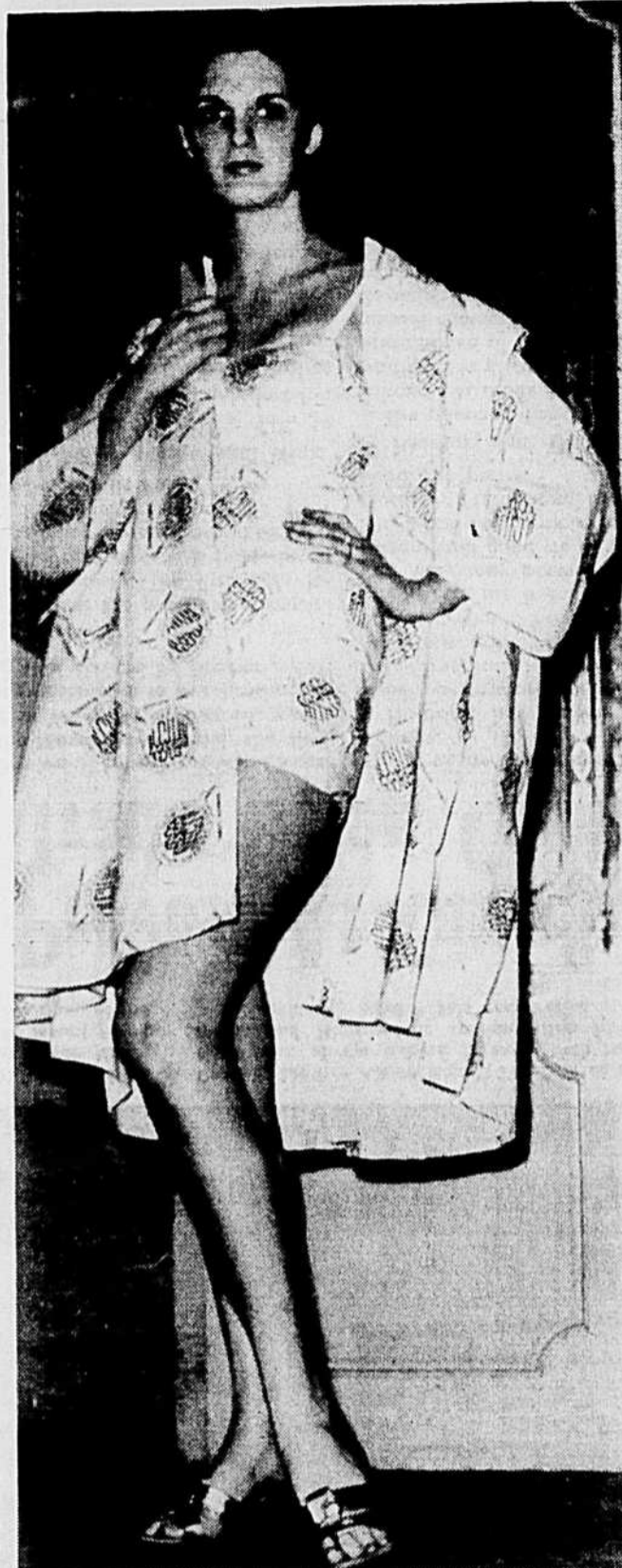
VOILA LE MAILLOT DE BAIN IDEAL, dont rêvent tous les curés de campagne et les chefs syndicaux. Il a le double avantage d'être décent et d'afficher l'étiquette syndicale. Avec la collection nationale de l'UIOVD, porter des vêtements de fabrication syndicale, ce n'est presque plus une question de conviction; c'est devenu une question d'élégance — et d'un minimum d'attention de la part de nos élégantes.