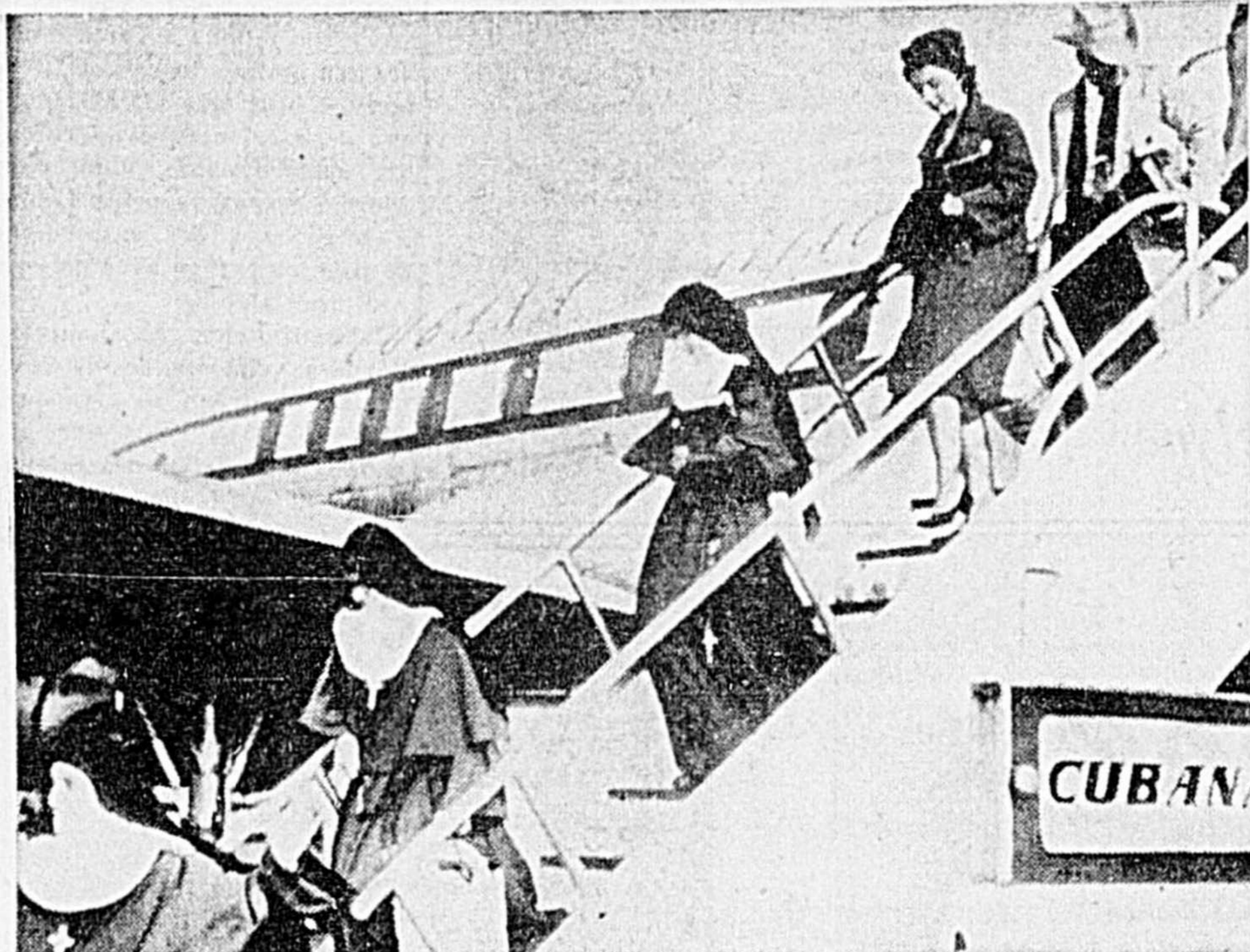
24 RELIGIEUSES ARRIVENT DE CUBA — Ces religieuses font partie des 62 qui ont dû évacuer Cuba. Un groupe de religieuses descendent de l'avion, à l'aéroport Idlewild, à New York.