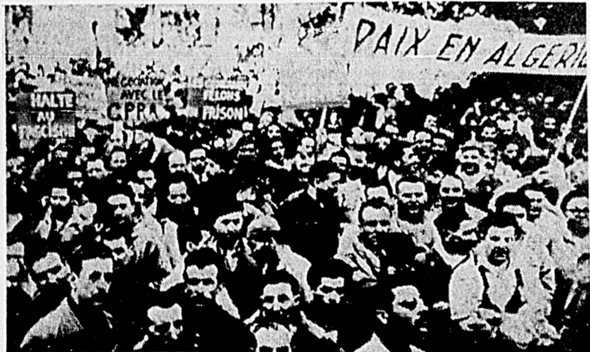
MANIFESTATION CONTRE L'INSURRECTION ALGERIENNE — Les résidents de Boulogne Billancourt, petite localité de Paris, se sont réunis sur la place centrale dans le but de protester contre la junte militaire qui a saisi le pouvoir en Algérie.