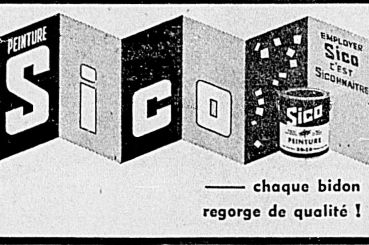
chaque bidon regorge de qualité!

les exigences requises. L'an dernier, 200 cadets furent entraînés sur six pilotes privés entraînés par le C. A. R. C. et 137 au Canada a été un Cadet de l'Air. Camps d'été senior Chaque été, 200 cadets choisis dans toutes les parties du Canada vont au Camp Borden du C. A. R. C. pour suivre deux cours de pilote et l'insigne de vol des (suite à la 2e page)