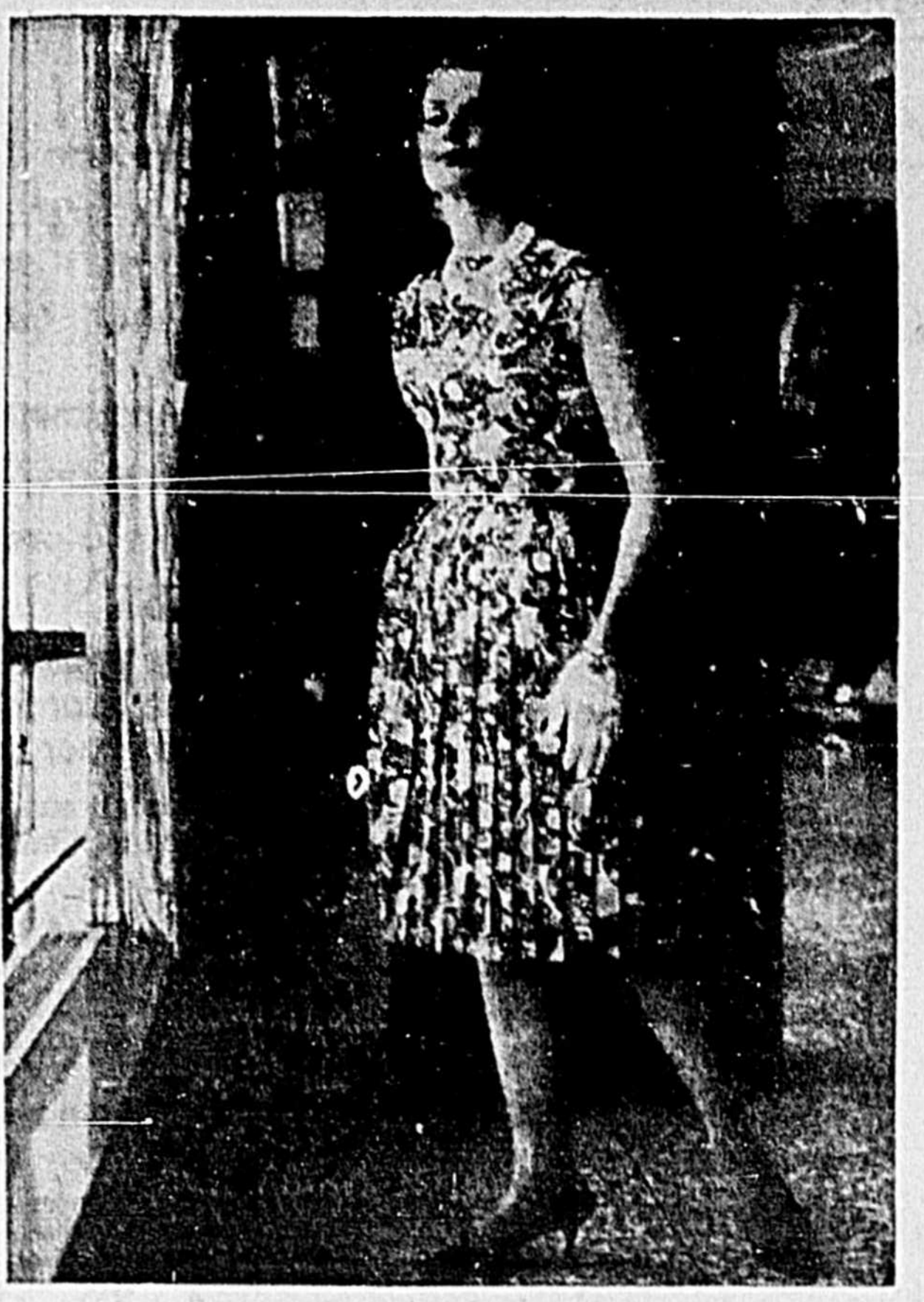
Voici une adorable petite robe en jersey d'Arnel imprimé. La jupe à plis permanents ajoute à cette création, la note de fraîcheur qu'exige le printemps '61'.