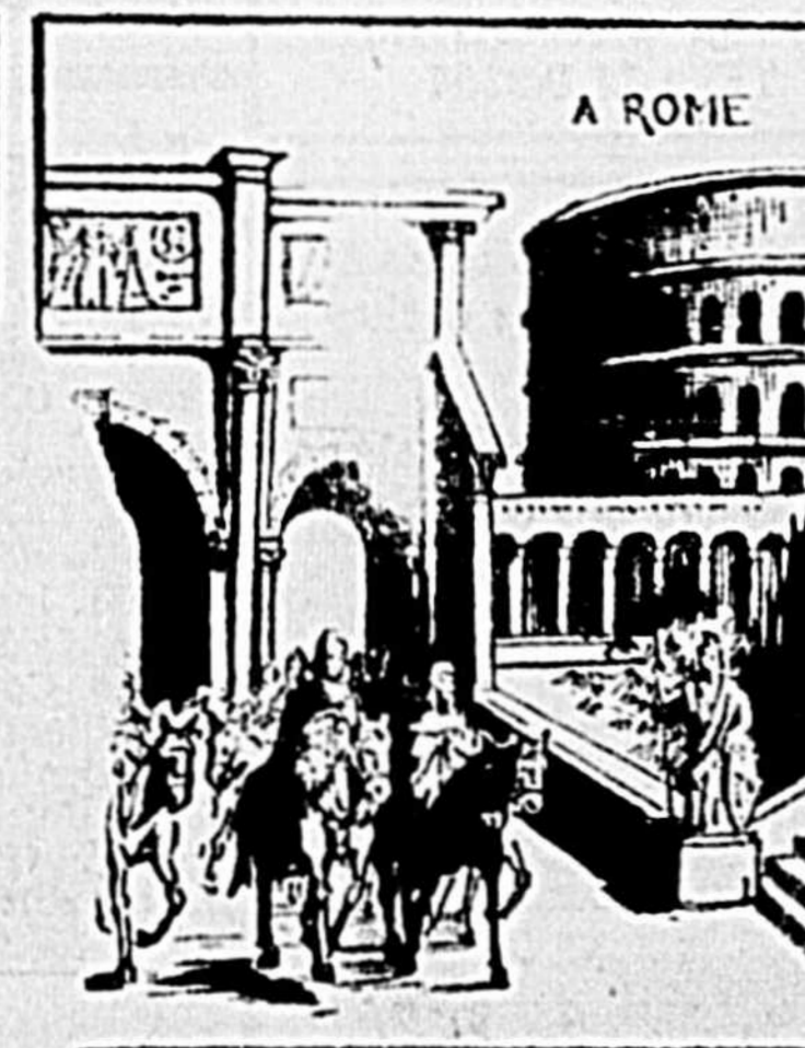
3. — Par le Via Appie, le convoi fait son entrée à Rome. La petite troupe longe les monuments imposants: arcs de triomphe, théâtres, temples, parques, qui font de Rome une cité si belle. Mais le cœur de l'apôtre ne s'attache pas aux beautés du décor; il remet à son Seigneur Jésus le soin de sa vie et de sa mission, en cette ville où il entre enchaîné comme un malfaiteur.