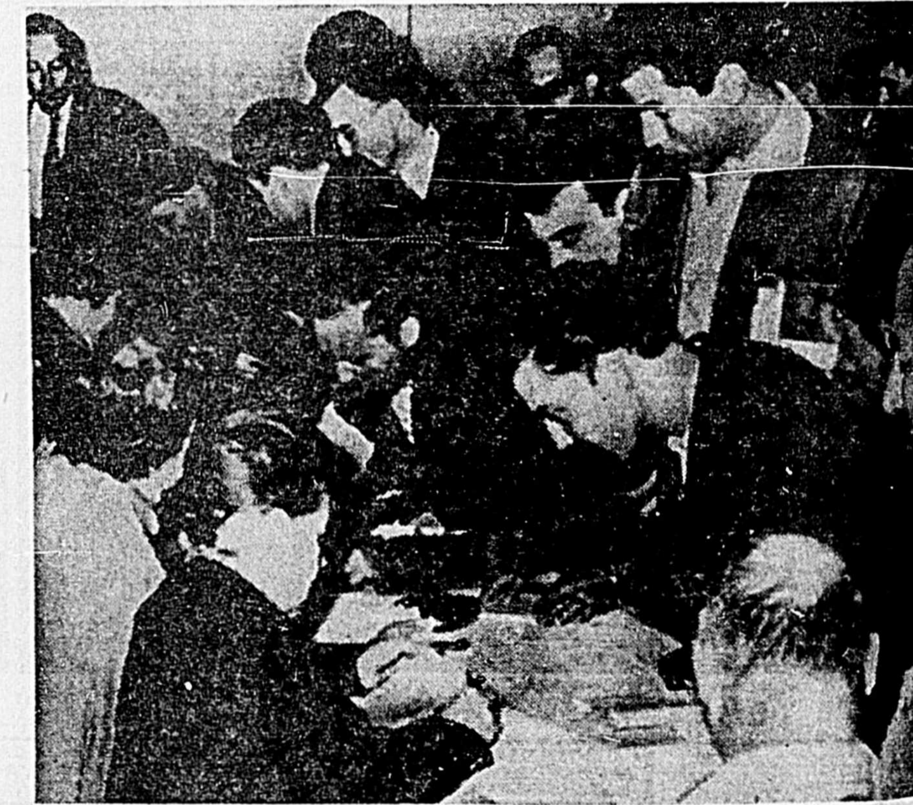
GRUPE DE JEUNES VOLONTAIRES — Des femmes inscrites dans les registres des noms des jeunes volontaires français pour le service militaires à Paris. Cette scène se passait alors que l'insurrection algérienne faisait rage. Ces jeunes ont répondu à l'appel du président de Gaulle.

Par ailleurs, la radio de Moscou accusait hier soir les Etats-Unis de mettre en danger le règlement pacifique de la guerre civile et déclarait que des avions de transport ont apporté dans la capitale de Vientiane de grandes quantités d'armes et de munitions très modernes.