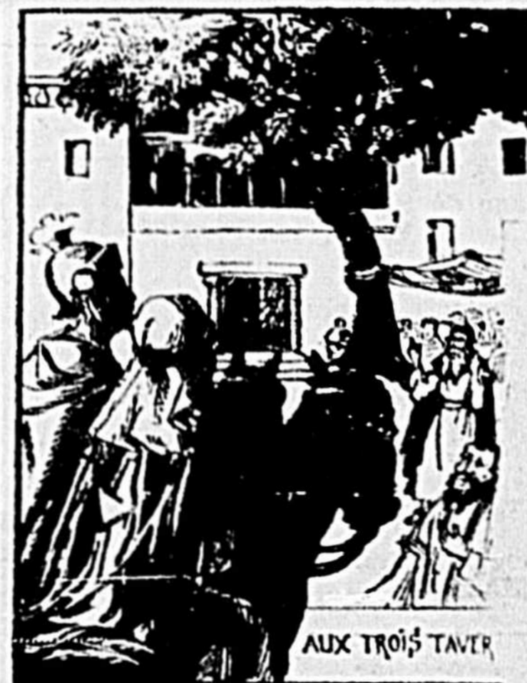
2. — Paul et son gardien font ensuite route vers Rome. On avait dû pourvoir le prisonnier d'une monture, de même que l'officier, car le route est longue jusqu'à Rome. En un endroit du Mareis Pontins, au lieu appelé "Trois-Tavernes", un groupe de chrétiens de Rome vint au-devant de l'apôtre. Ce lui fut un grand reconfort.