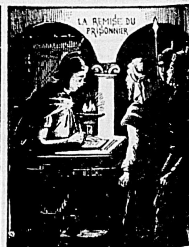
4. — Le centurion Julius alla humblement faire d'abord remise de son prisonnier. Voici l'inscription du voyageur au greffe de justice; comme le rapport du procureur est favorable, l'apôtre est autorisé à habiter en dehors du camp, dans une maison, sans doute procurée par les chrétiens de Rome. Il est accompagné par un soldat dont le boss est lié ou sien par une chaîne. Il peut recevoir toutes les personnes qui veulent l'écouter et lui parler.