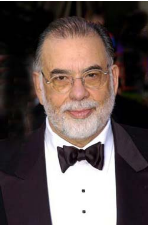
Francis Ford Coppola

L'une des découvertes pour les amateurs de vin depuis les dernières années est la qualité des vins de la Californie. Parmi les vignobles de ce territoire on remarque ceux du cinéaste Francis Ford Coppola, qui est propriétaire de deux vignobles prestigieux: Rubicon Estate situé à Rutherford et Francis Coppola Winery à Geyserville, tous deux à Napa Valley. Coppola est dans l'industrie des vins depuis 1975. Ses produits sont reconnus au niveau mondial comme étant d'une qualité supérieure. LeStudio1.com est fier d'offrir à Francis Ford Coppola et à son équipe une place dans la galerie Les Meilleurs LeStudio1.com à titre de meilleur vignoble mondial en 2006.