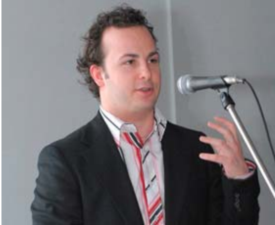
Le chef Yannick-Nézet Séguin