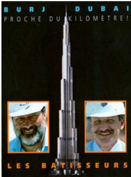
Tour arabe

La tour Burj Dubai est en voie de surpasser tous les autres édifices au monde au niveau de sa hauteur. On prévoit qu'elle approchera 1 kilomètre de haut. Un sommet estimé à 162 étages plus une antenne et dont le site comprendra un hôtel, un espace résidentiel et des bureaux commerciaux. Jacques Robert a profité de son séjour à Dubai pour photographier le chantier de construction et il nous offre un reportage photo.