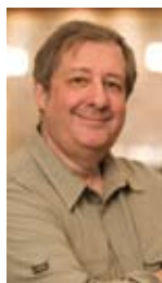
Figure emblématique du paysage gastronomique montréalais, Philippe Mollé se targue de défendre et de mettre en valeur les artisans du goût. Chef de formation et auteur de 10 ouvrages portant sur la cuisine et l'alimentation, il est également consultant, chroniqueur bien connu des auditeurs de Radio-Canada et critique de restaurants.