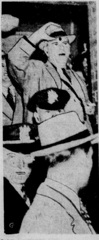
FRITZ KUHN, fuhrer des nazis allemands des Etats-Unis, a dû quitter une salle sous la protection de la police, ces jours derniers à Union City, New-Jersey, parce que la population voulait le lapider, tellement la majorité des Américains ont le fascisme en horreur. On le voit, à gauche, quittant la salle. A droite, on fait brûler l'effigie de HITLER. KUHN devait parler pour "célébrer" la victoire de HITLER sur la Tchécoslovaquie, mais cette manifestation n'avait rien de populaire, comme on le constate.