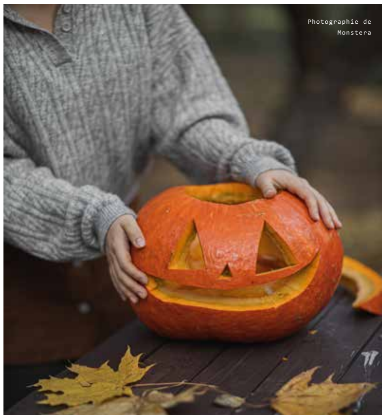
Photographie de Monstera

Quand : le samedi 29 octobre entre 13 h 30 et 15 h. Nous les numéroterons pour les identifier et le dimanche 30 octobre les paroissiens voteront pour leur citrouille préférée, après la célébration. Vous pourrez récupérer vos beautés entre 13 h 30 et 14 h 30 le dimanche. On vous donnera aussi le nom de l'artiste vainqueur et des friandises. Vous pouvez venir déguisés, surprenez-nous!