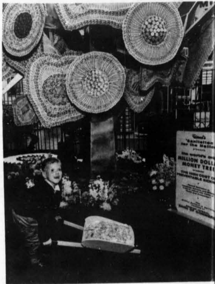
L'ARBRE AU MILLION DE DOLLARS DE G. H. WOOD & COMPAGNIE A L'EXPOSITION NATIONALE CANADIENNE VIENT EN AIDE AUX ENFANTS INFIRMES.

Aucune des variétés russes n'est homologuée au Canada; ainsi, les semences ne sont pas admises dans le commerce. L'importateur doit donc les faire cultiver sous contrat.