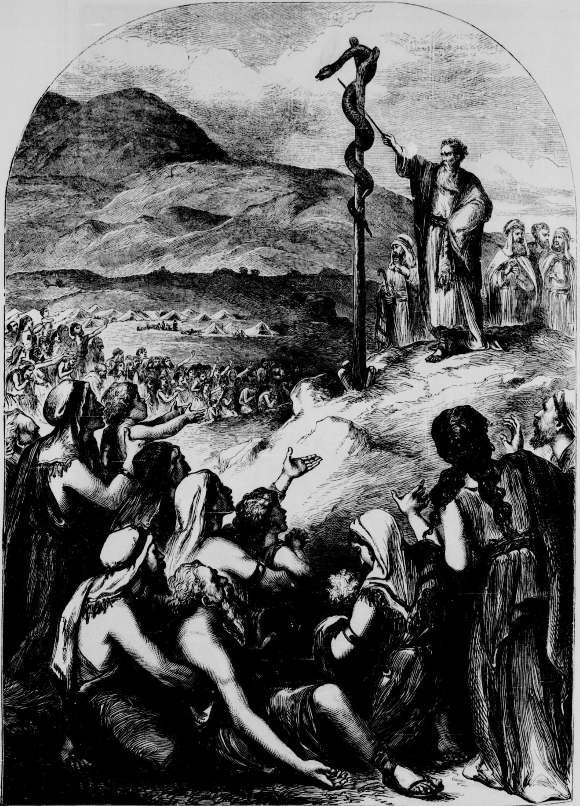
MOÏSE ET LE SERPENT D'AIRAIN DANS LE DÉSERT