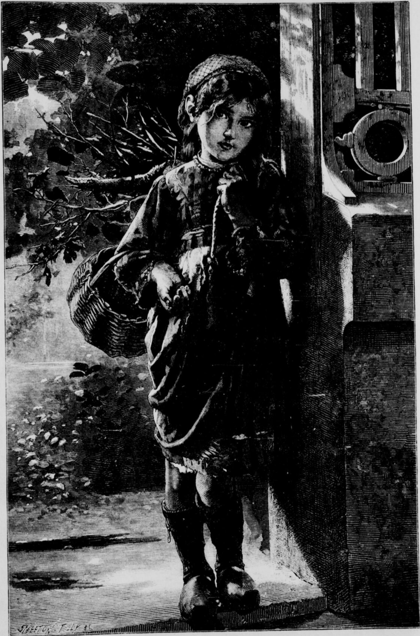
UN PETIT SOU. — TABLEAU DE H. PERRAULT