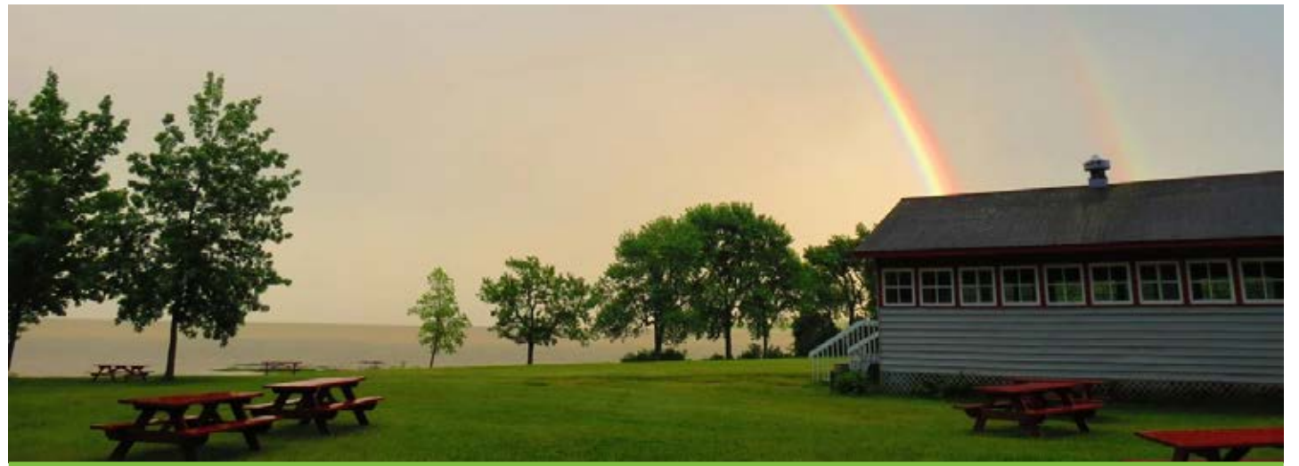
Le Camp Saint-François a été fondé en 1949.

Tir à l'arc, baignade, hébertisme, soccer, bricolage, course au trésor, randonnée pédestre, jeux en grand groupe font partie des activités proposées lors des camps de jour, des classes vertes ou lors de locations.