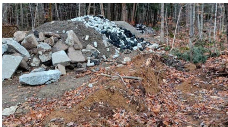
On remarque ici un talus préexistant, ce qui laisse entendre qu'il ne s'agit pas du premier épandage. Un site d'enfouissement en pleine forêt ?