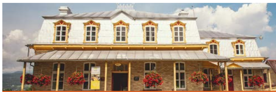
La Maison de nos Aïeux demeurera ouverte durant la durée des travaux.

Veuillez noter que le stationnement situé près du hangar à dîme ne sera pas accessible pendant les travaux. Les visiteurs devront se garer dans le stationnement de l'église de Sainte-Famille.