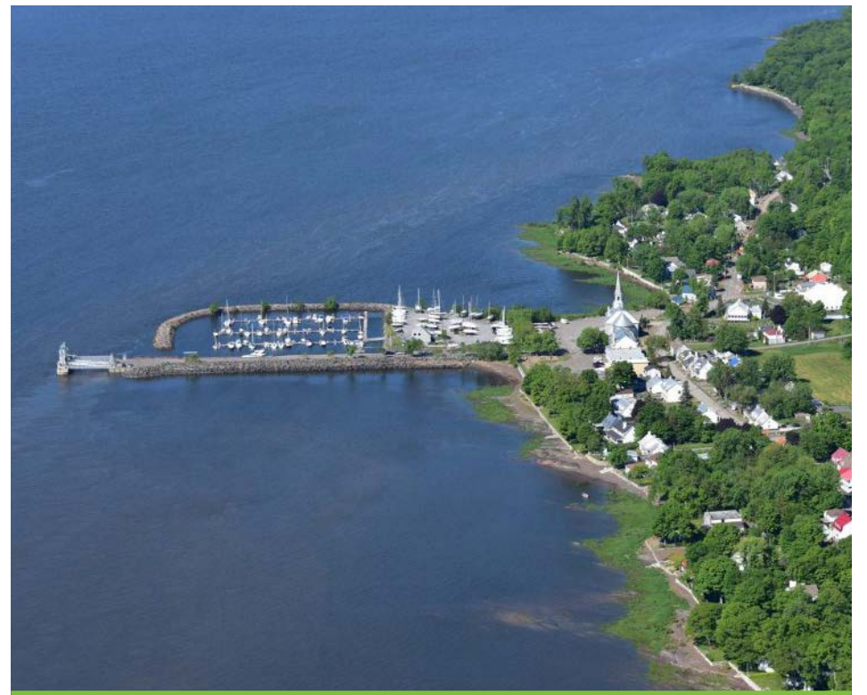
Vue aérienne du village de Saint-Laurent.

« Si la navette bleue d'AML qui propose une croisière sur le fleuve en passant par Québec, Lévis et Saint-Laurent, se concrétise, la navette verte pourrait constituer une possibilité. La MRC de L'Île-d'Orléans a commandé une étude de faisabilité. Trois autobus de 24 passagers partiraient de l'église aux demi-heures à sens inverse, du matin jusqu'au soir. Il s'agit d'un projet de trois ans qui ne verra pas le jour en 2023 », a précisé M. Coulombe.