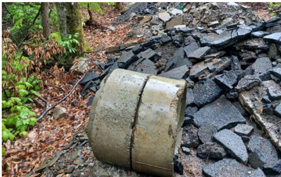
L'asphalte et le béton sont des matériaux qu'il est possible de valoriser, notamment pour la construction de routes. Il s'agit ici plutôt d'enfouissement de matières résiduelles pourtant strictement réglementé en ce qui concerne le stockage, le conditionnement et la réutilisation.

5- « Nul ne peut déposer ou rejeter des matières résiduelles, ni permettre leur dépôt ou rejet, dans un endroit autre qu'un lieu où leur stockage, leur traitement ou leur élimination sont autorisés par le ministre ou le gouvernement en application des dispositions de la [loi et de ses règlements] ». - LQE, art.66.