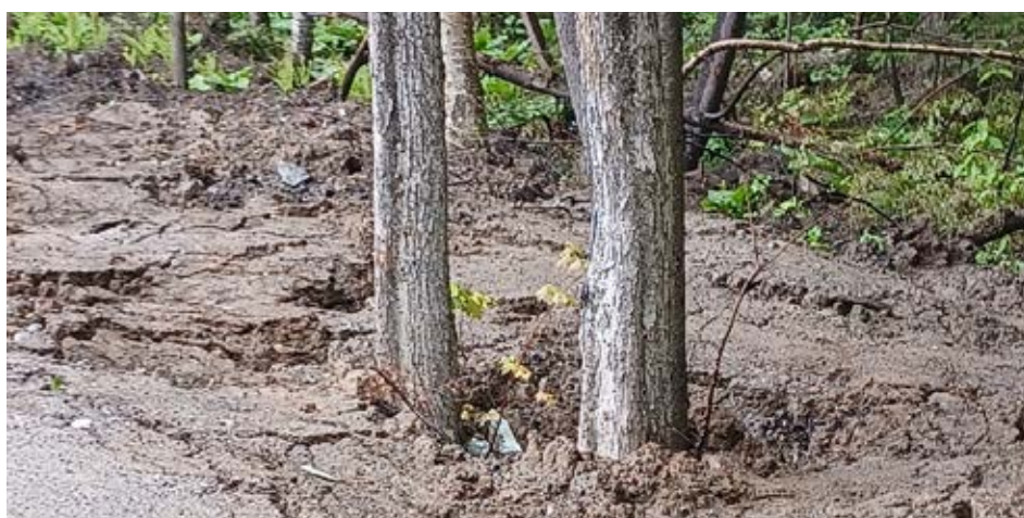
Le couvert de terre indique une volonté de dissimulation. Si l'intention avait été de construire un chemin forestier, par exemple, une couche de roulement faite d'un granulats quelconque aurait été requise en surface, des fossés creusés pour assécher les lieux, etc. D'ailleurs, un chemin doit normalement mener quelque part; ici, pas de destination apparente !