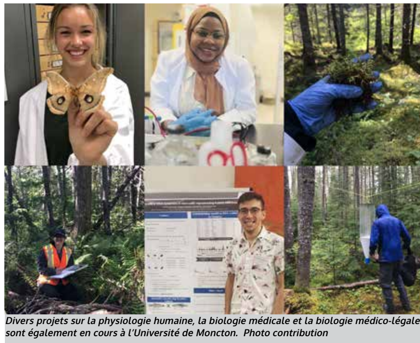
Divers projets sur la physiologie humaine, la biologie médicale et la biologie médico-légale sont également en cours à l'Université de Moncton. Photo contribution

Les projets en génétique étudient diverses espèces animales et végétales pour de nombreuses raisons. Par exemple, dans le contexte d'un changement de distribution des espèces en réponse au changement climatique, une étude porte sur l'évolution du génome des espèces de poissons du lac Porter en Nouvelle-Écosse où des individus hybrides se reproduisent de manière asexuée. Une autre étude porte sur les marqueurs de stress du crabe des