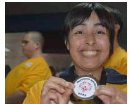
Les adeptes de quilles étaient prêts à donner leur 100 % pour remporter des médailles.