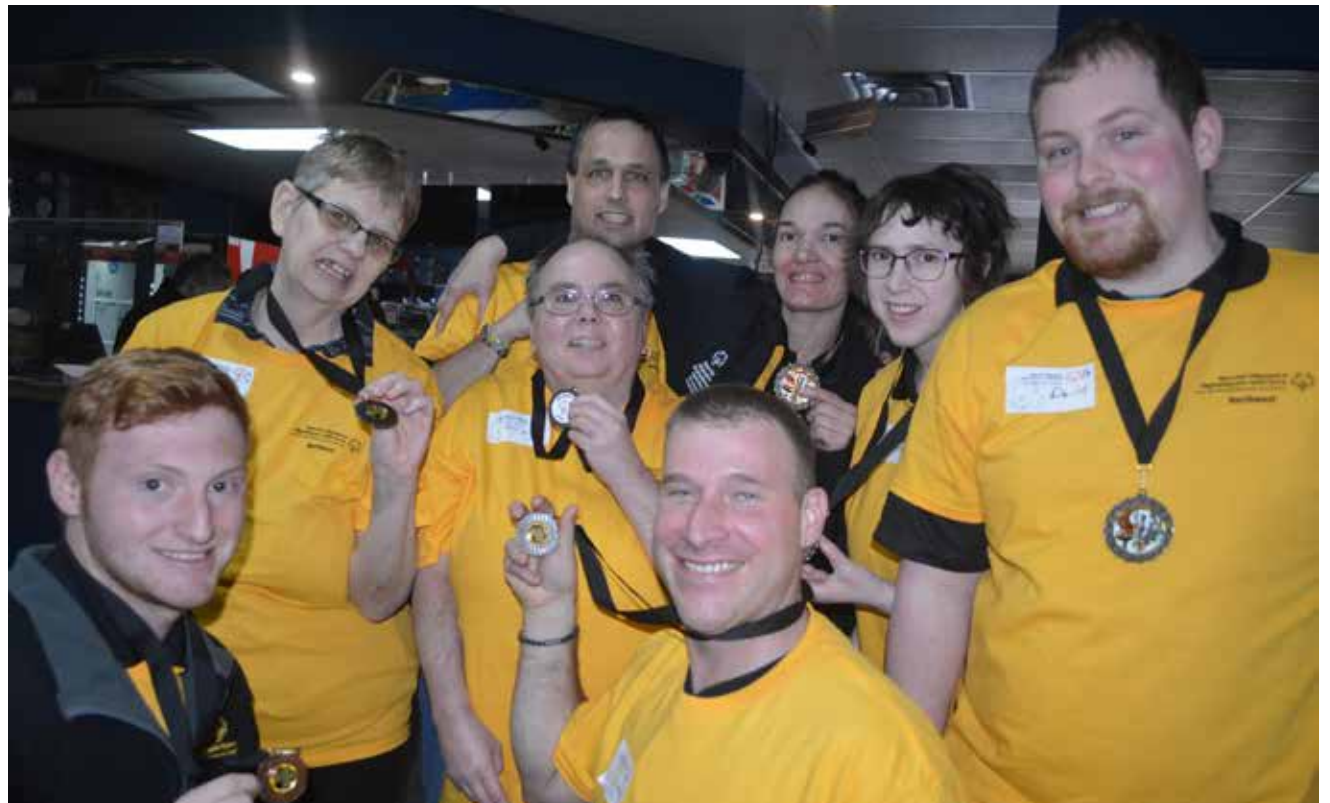
Ces médaillés étaient extrêmement fiers de leur victoire.

Sur le site officiel de l'organisme, on confirme notamment que «les fonds amassés par Olympiques spéciaux Nouveau-Brunswick soutiennent plus de 1500 participants à travers la province». De plus, les dirigeants du regroupement estiment que «tout le monde a la capacité d'être engagé et de se développer