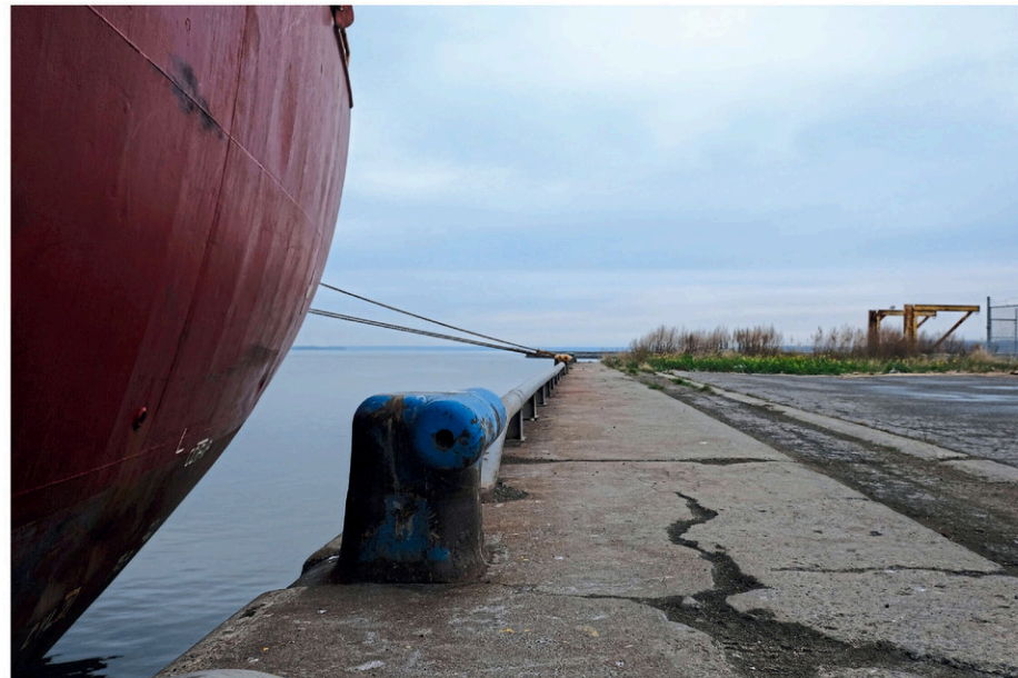
Port de Bécancour.

Vous pouvez également communiquer avec un représentant du Programme d'aide financière aux participants en écrivant à fp-paf@iaac-aeic.gc.ca ou en composant le 1-866-582-1884. Les détails du projet sont également disponibles sur la page d'accueil du projet.