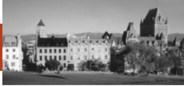
QUÉBEC : VILLE DE LUMIÈRES ARCHITECTURE DE LA RUE DALHOUSIE