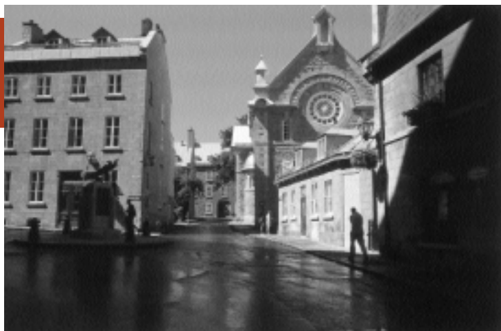
QUÉBEC : VILLE DE LUMIÈRES RUE DU PARLOIR