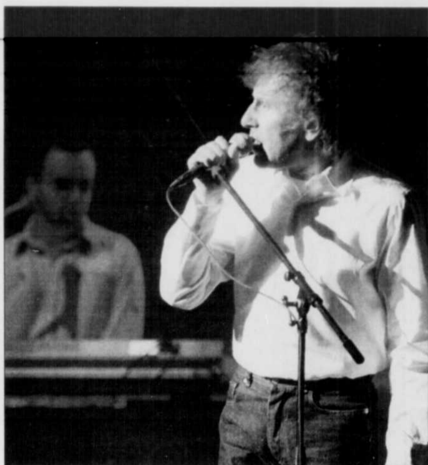
Alain Souchon et le claviériste Jean-Luc Leonardon.

C'est ainsi que, présentant une forme olympienne malgré ses 56 ans, le chanteur a interprété avec aplomb et dynamisme — on était loin de le croire aussi mobile sur scène! — l'essentiel de son dernier album ( Petit tas tombé , Le Baiser , Rive gauche , Tailler la zone et la rigolote Carterpillar ), en plus de sa sélection personnelle de classiques, allant de la ballade à la rumba, en passant par le pop et le rock ( Ultramoderne solitude , Foule sentimentale , Y'a d'la