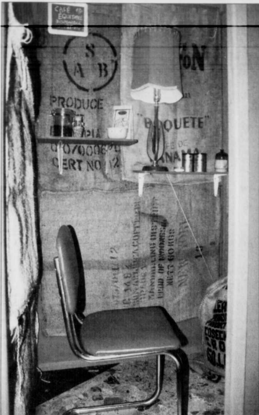
C'est aujourd'hui que se termine l'exposition «Sans parole», une installation-vidéo du collectif Les p'tites mères, à la bibliothèque Gabrielle-Roy.

Cartel (4) 12h45, 15h30, 18h45, 21h30 (13 ans). Le retour de la momie (5) 12h45, 15h30, 18h45, 21h30 (13 ans). Entre sœurs (1) 13h, 15h30, 19h, 21h30 (16 ans). Chevalier (5) 13h, 15h30, 19h, 21h30 (18 ans). Les yeux d'un ange (1) 13h, 15h30, 19h, 21h30 (13 ans). Tarifs: Ven. sam. dim. (soir): 9$. 13 à 20 ans: 6.50$. 12 ans et moins et 65 ans et plus: 4$. Ven. sam. dim. (jour): 6.50$. 12 ans et moins et 65 ans et plus: 4$. Lun. mar. mer. 6.50$. 12 ans et moins et 65 ans et plus: 4$. Jeudi: 4.50$. 12 ans et moins et 65 ans et plus: 3.50$.