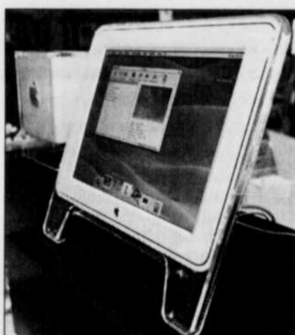
Autant s'habituer, Apple n'offrira plus, ces prochains mois, que des écrans à matrice active de type « panneau ».

Le plus modeste des iBook est à 2039 $ (200 $ de moins que le précédent) avec