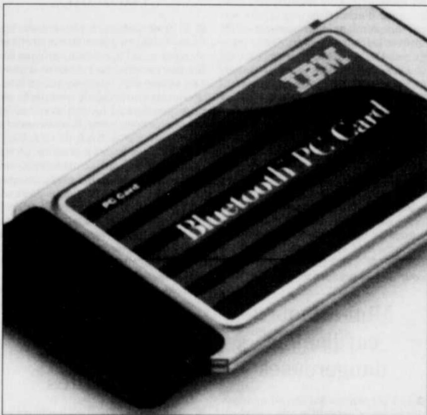
Le Bluetooth d'IBM permet d'accéder directement au serveur.

Si la technologie Bluetooth et celle du branchement sans fil (802.11) pour les entreprises coûtent cher actuellement, les prix devraient s'ajuster avec l'accroissement de la demande, estime M. Turgeon.