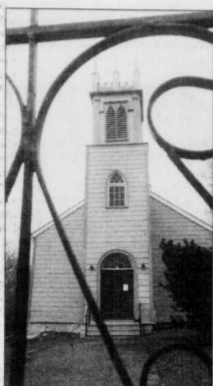
L'église anglicane, témoin de la diversité religieuse des XIX e et XX e siècles.

RIVIÈRE-DU-LOUP — Le patrimoine bâti de Rivière-du-Loup est d'une grande richesse. Denis Boucher, agent culturel et coordonnateur pour le réseau Villes et villages d'art et de patrimoine, affirme que le rôle de métropole industrielle que jouait Rivière-du-Loup au XIX e siècle, explique en grande partie la présence d'une imposante concentration de bâtiments architecturaux d'une valeur exceptionnelle.