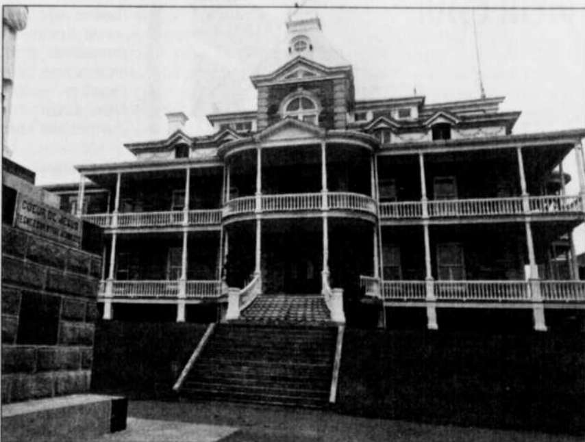
Le presbytère de Saint-Patrice, que certains n'hésitent pas à qualifier de « reine de Rivière-du-Loup ».