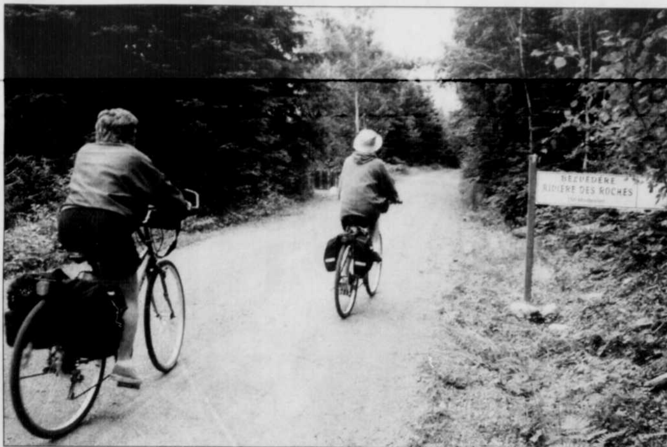
Les cyclistes sont choyés par la présence de la piste « Petit Témis » qui relie Rivière-du-Loup au Nouveau-Brunswick.