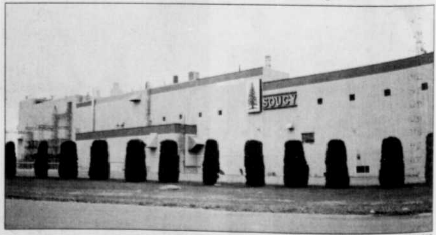
La papetière F-F Soucy est étroitement associée à la vie économique et sociale de Rivière-du-Loup et de sa région. Depuis 1963, cette entreprise produit du papier-journal. Plus de 300 personnes y trouvent un emploi.