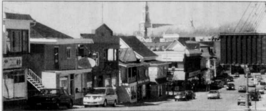
La rue Lafontaine est particulièrement animée, de jour comme de nuit.

Non loin de là, le Rodéo Country s'y déroule du 27 juin au 1er juillet, et 'Pleins feux Rivière-du-Loup', un spectacle pyromusical, prend la vedette les 20 et 21 juillet. Tout cela sans parler du Motocross intérieur ou du grand Rendez-vous panquébécois de Secondaire en Spectacle en mai, des théâtres d'été, du Concours intercollégial de sculptures sur neiges Desjardins et du tournoi de hockey Pee-Wee Neige, de même que du Festival international d'accélération sur glace en février. M.L.