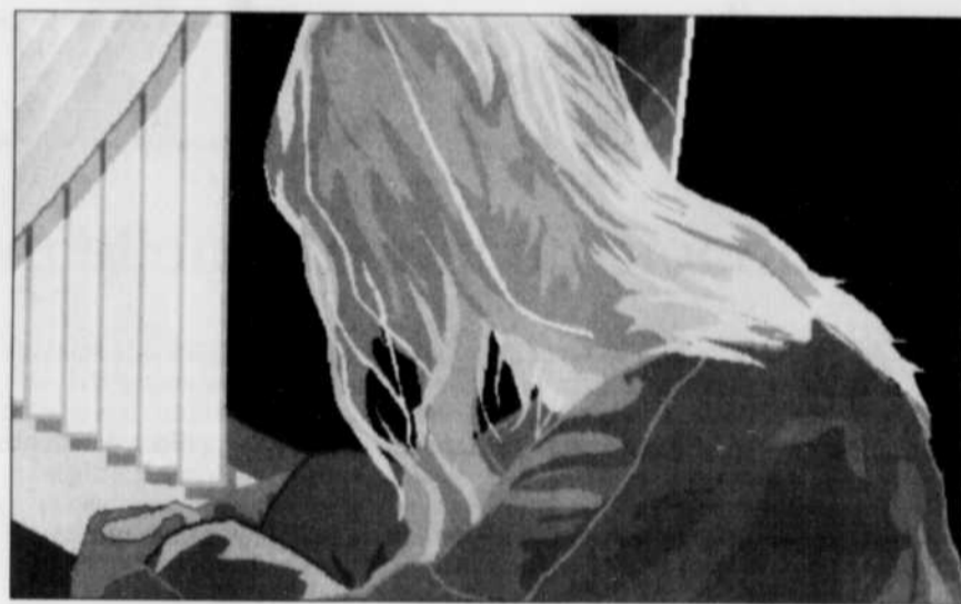
Le traitement miracle contre l'autisme n'existe tout simplement pas.

Des progrès indéniables ont été observés ces vingt dernières années