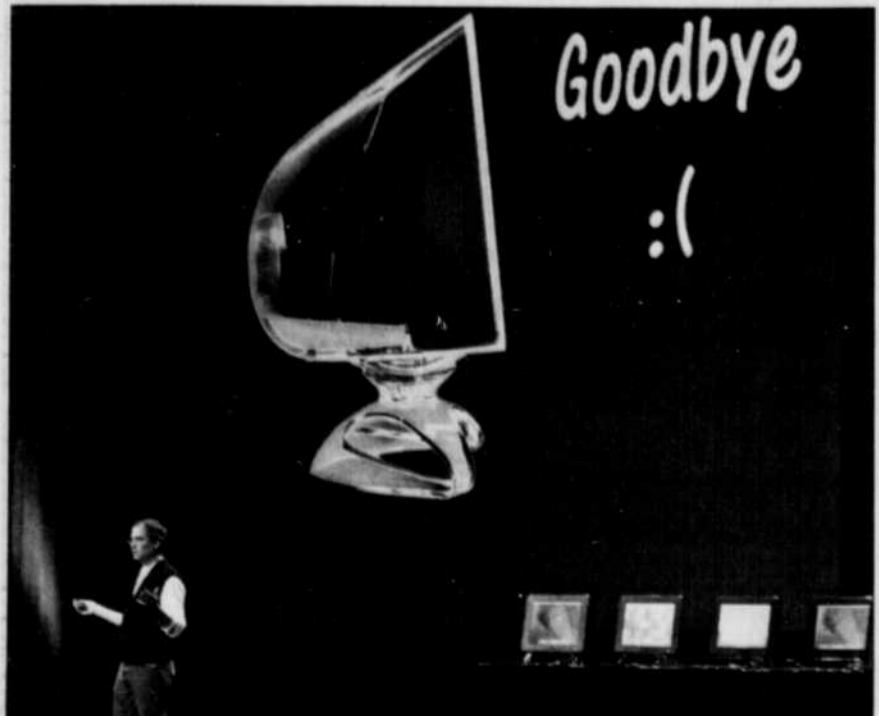
Le grand manitou d'Apple, Steve Jobs, a annoncé cette semaine que son entreprise serait la première à offrir une gamme complète de moniteurs professionnels ACL à écran plat. Son message d'adieu au moniteur à tube conventionnel était pour le moins clair.