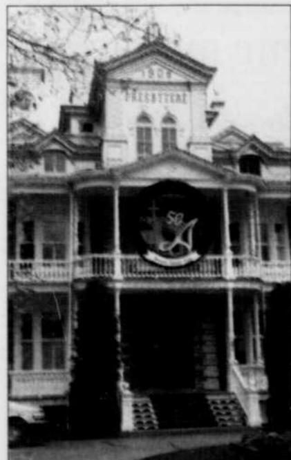
Le presbytère de Saint-Patrice de Rivière-du-Loup.