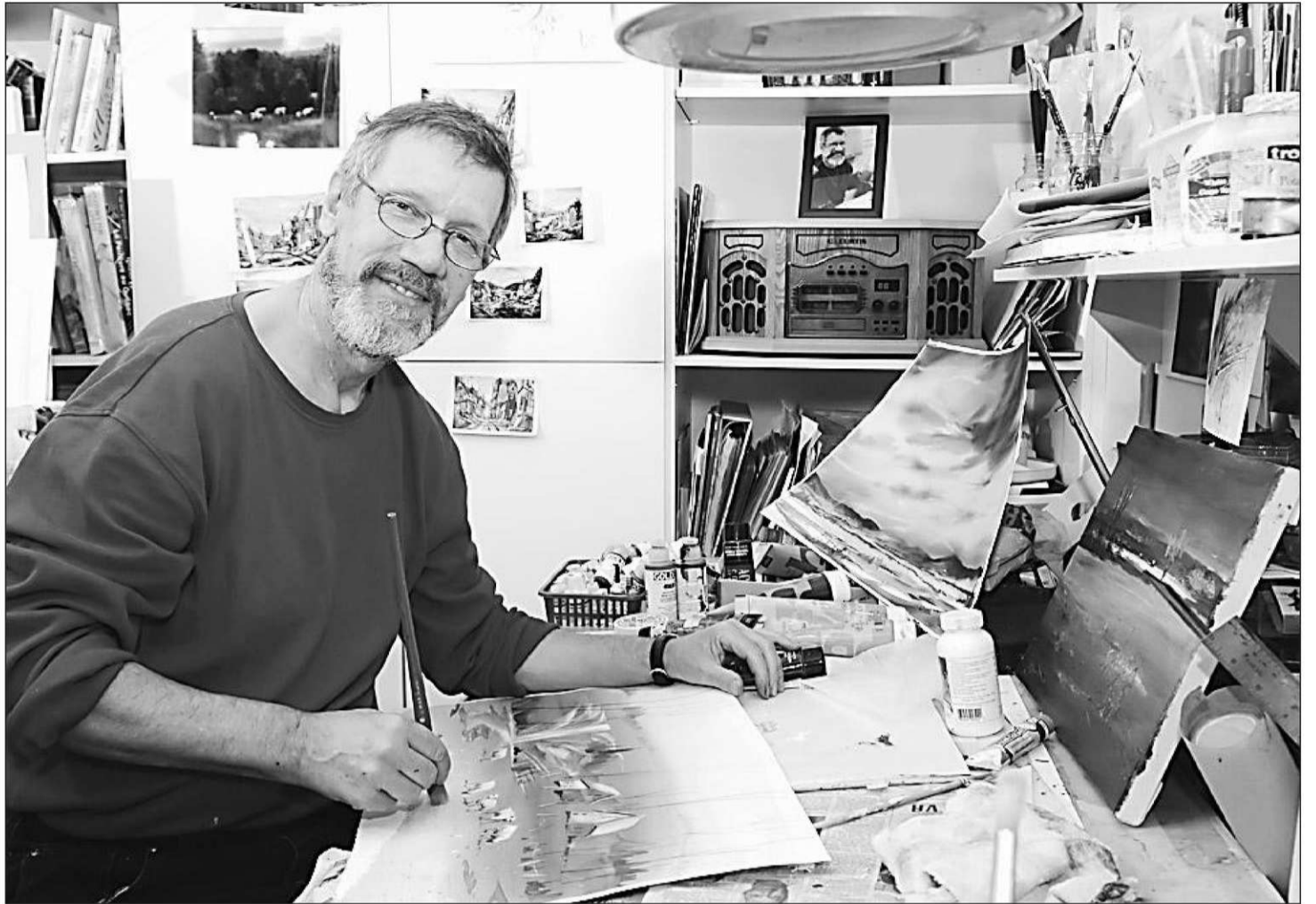
IMACOM, CLAUDE POULIN

Toujours à la Maison des arts et de la culture, l'été sera particulièrement chargé avec la seconde édition des Jardins réinventés comportant encore plus d'éléments, du 20 juin au 30 août. Une belle façon de vivre l'art dans le cadre enchanteur des lieux, bercés par les flots tranquilles de la Saint-François tout à côté.