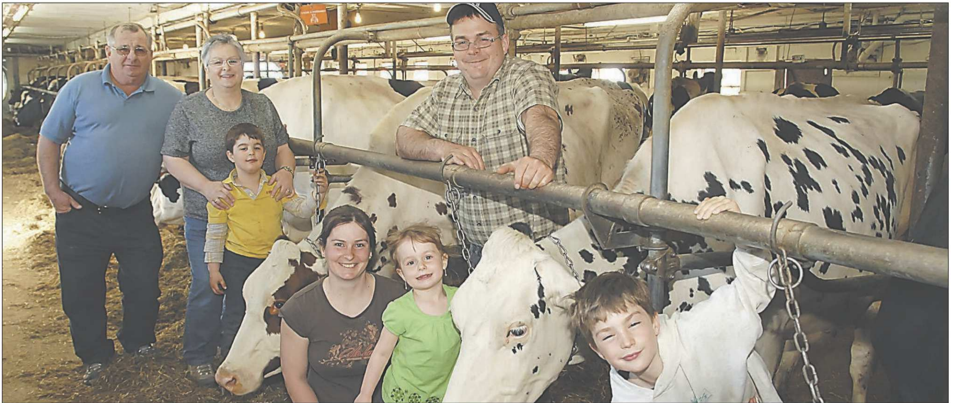
IMACOM, CLAUDE POULIN