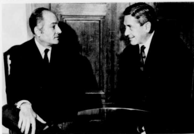
Pierre Daninos, le célèbre humoriste français, a été, entre tant d'autres personnalités, l'invité du Sel de la semaine animé par Fernand Seguin.