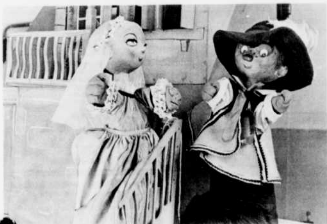
Pépinot et Capucine , les deux vedettes à tête de bois mais au cœur d'or de la première série télévisée expressément pour les enfants par Radio-Canada.