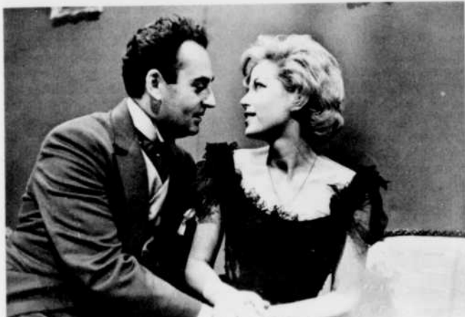
Guy Provost et Mathé Altéry, les deux vedettes d'une des plus éblouissantes productions musicales: les Trois Valses.