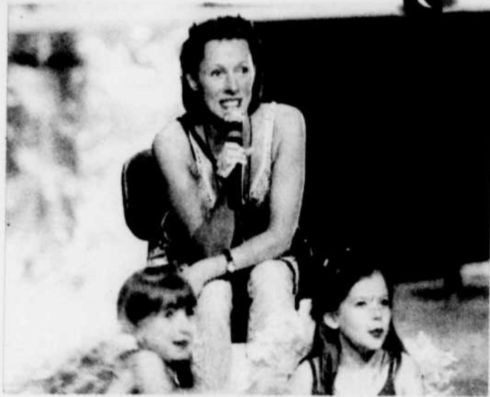
Myrtha Cat n'a que de bonnes nouvelles en vue de la prochaine saison.

Très grosse année en vue pour le Studio de danse Myrtha Cat, de Beloeil, qui déménage ses pénates dès le 1er septembre dans le Centre commercial des Villas, plus précisément au 290, boulevard Yvon-L'Heureux. Il s'agit d'une excellente nouvelle pour la propriétaire du Studio, qui cherchait à s'installer ailleurs depuis quelque temps déjà. C'est dans des locaux spacieux et entièrement rénovés, tant à l'intérieur qu'à l'extérieur, que les 400 à 450 danseurs et la dizaine d'entraîneurs évolueront à compter de septembre. "Il y aura un nouveau décor. Ce sera très beau et beaucoup plus fonctionnel." Ce déménagement permet notamment à Myrtha Cat de résoudre une fois pour toutes le problème de stationnement qui existait sur Bernard-Pilon.