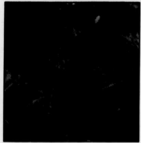
L'herbe à poux est une plante facilement identifiable: elle a une feuille mince et découpée et sa couleur vert est uniforme des deux côtés. Sa tige est velue et a peu de racines.

Pour empêcher l'herbe à poux de pousser, on peut s'attaquer aux graines qui germent dans le sol en bloquant la levée des plants par des paillis (par exemple, du paillis de cèdre) ou encore par une toile géotextile. Il faut se rappeler que l'herbe à poux ne tolère aucunement la concurrence. Un jardin bien fleuri et un gazon bien fourni sont donc peu sujets à être envahis par cette mauvaise herbe. Implanter un couvert végétal (fleurs annuelles, fleurs sauvages vivaces, couvre-sol) sur les parcelles dégarnies de votre terrain limitera aussi l'envahissement par l'herbe à poux.