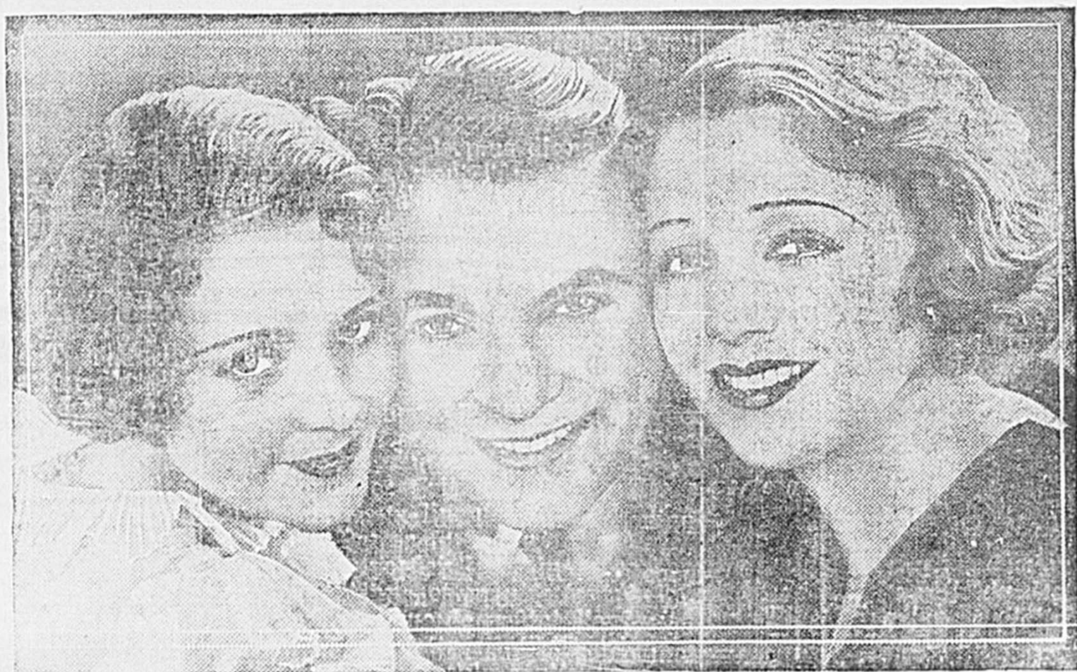
RUBY KEELER — GEORGE BRENT — BEBE DANIELS dans "42nd STREET" au Théâtre Auditorium, Lundi et Mardi — A Prix Réguliers

Nos agents auront des cartes pour les identifier.