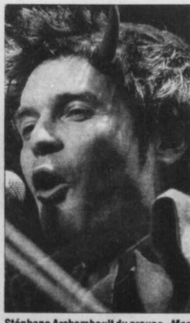
Stéphane Archambault du groupe «Mes Aïeux»