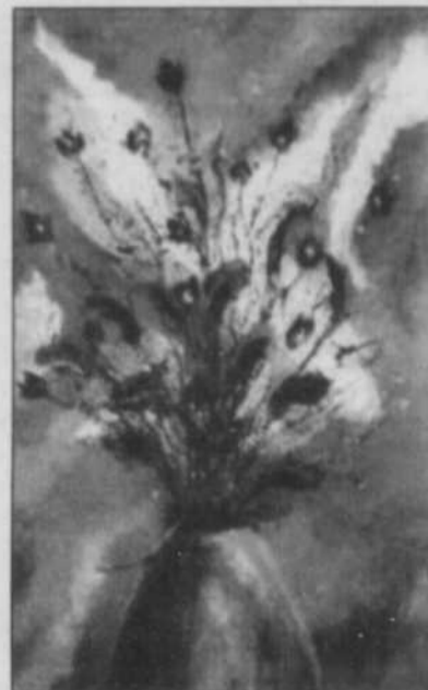
TOILE - C'est cette oeuvre de Thérèse Fortin, intitulée «Dahlia», qui a récemment été vendue 4000 euros lors d'un encan français.

Elle est aussi la tête du mouvement «Émergence».