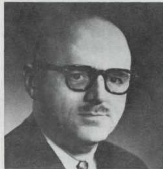
M. JEAN DRAPEAU Maire de Montréal et conférencier-invité lors du Congrès 1980.