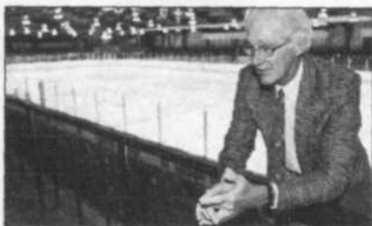
LES NOUVEAUX VISAGES DU HOCKEY SEMI-PRO 11