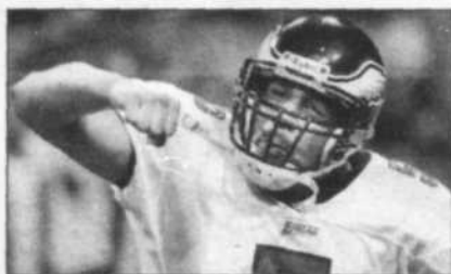
LA NFL EN 2002 ET LA CHRONIQUE DE FRANÇOIS RATTÉ 12 À 17