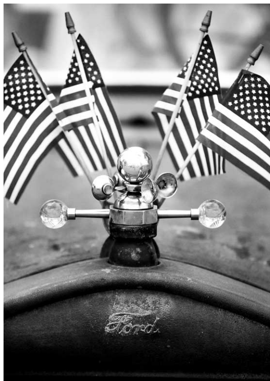
Des drapeaux américains ornent le capot de ce fameux Ford de modèle « T » de 1926 en montre à Dearborn, dans le cadre du centenaire de Ford.