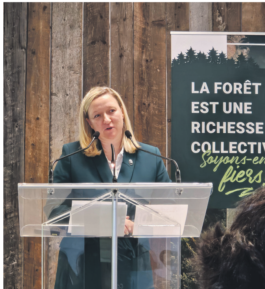
La ministre des Ressources naturelles et des Forêts Maïté Blanchette-Vézina.

«Sans reconnaissance concrète de nos droits et sans volonté réelle de co-construction, il s'agit d'une démarche que nous ne pouvons pas cautionner.»