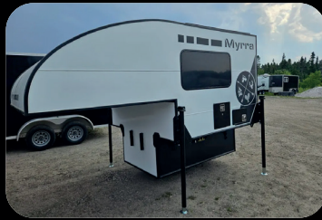
BBI MYRRA 2025 # inventaire : BC25010