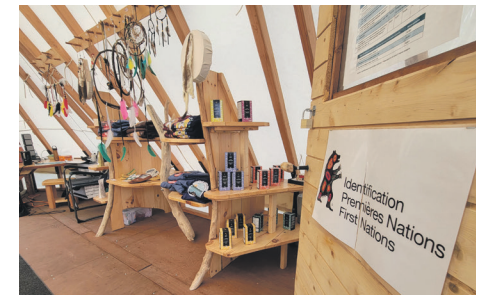
Un espace d'accueil pensé pour créer des échanges authentiques entre visiteurs et membres de la communauté.

Tourisme Pessamit tient toutefois à être transparent sur la démarche. Les visites guidées intègrent aussi des éléments d'appréciation culturelle, qui ne sont pas tous spécifiques à la culture innue.