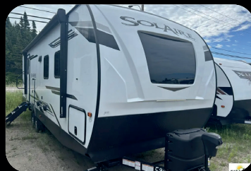
Palomino Solaire 2023 - 258RBSS # inventaire : BC23026