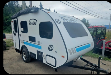
Prolite PLUS S 2025 # inventaire : BC25001