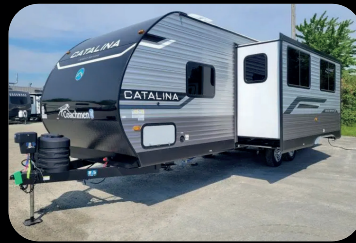
Coachmen Catalina 2026 - 263BHCKLE # inventaire : BC26010