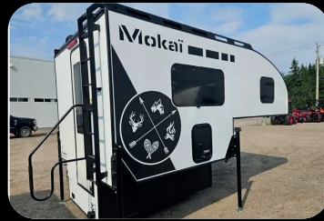
BBI MOKAI 2025 # inventaire : BC25009