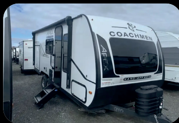
Coachmen Apex 2026 - 203RBK # inventaire : BC26004