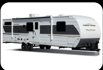
Forest River Wildwood 2025 - 29VBUD # inventaire : BC25007