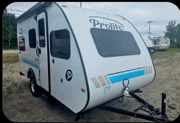
Prolite Evasion 2025 # inventaire : BC25003