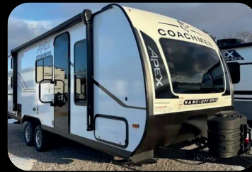
Coachmen Apex 2026 - 208BHS # inventaire : BC26005