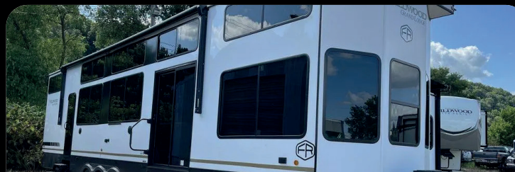
Forest River Wildwood 2025 - 44VIEW # inventaire : BC25008