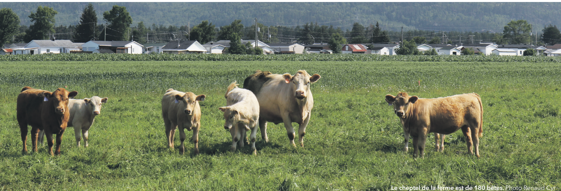
Le cheptel de la ferme est de 180 bêtes.

Depuis son retour à la ferme, les prix continuent de monter et l'agriculteur estime qu'ils ont plus que doublé, notamment en raison de la situation aux États-Unis.