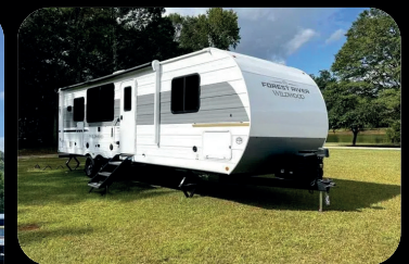
Forest River Wildwood 2025 - 27RK # inventaire : BC25006