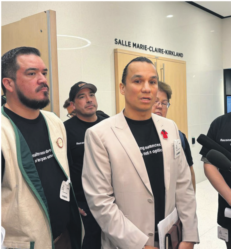
Le chef de l'Assemblée des Premières Nations Québec-Labrador s'est prononcé contre l'actuelle réforme du régime forestier présentée par la ministre Maïté Blanchette-Vézina.

La table de concertation de haut niveau devait ainsi agir à titre de point de rencontre pour l'élaboration de «termes et objectifs clairs» permettant de guider les échanges. Toutefois, les discussions avec la ministre sont freinées par l'absence d'engagements clairs, explique l'APNQL.