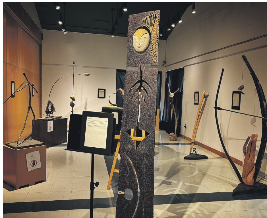
Une œuvre de l'exposition Entre mythes et cultures .

Pour les matériaux, les sculptures sont composées de métal recyclé de la Toupie de Tadoussac, du granite, de la corde, des os, du bois et du bronze.