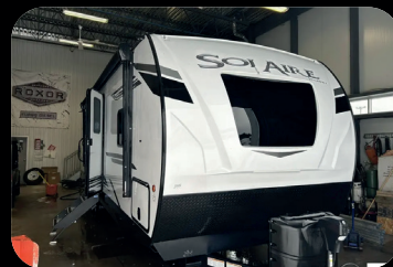
Palomino Solaire 2023 - 294DBHDS # inventaire : BC23032