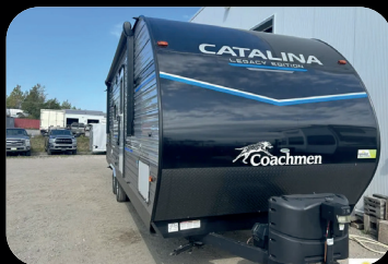
Coachmen Catalina 2023 - 243RBS # inventaire : BC23048