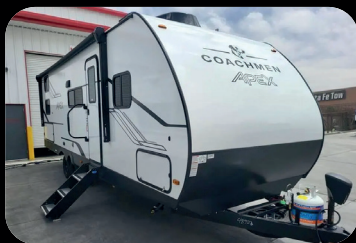
Coachmen Apex 2026 - 26BHX # inventaire : BC26002