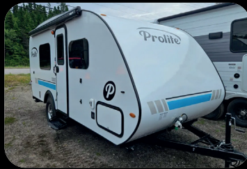
Prolite Classic 2025 # inventaire : BC25004