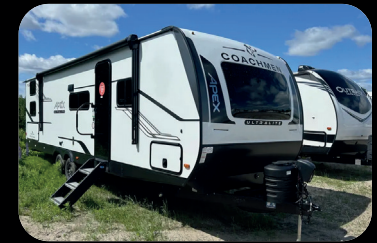
Coachmen Apex 2026 - 291TBSS # inventaire : BC26001