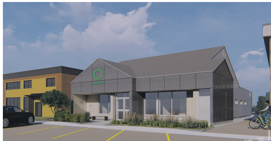
La Caisse populaire du Centre de la Haute-Côte-Nord va changer de look à l'automne.

« Il y a quelques travaux qui se font à l'intérieur, mais la plus grosse différence que l'on va voir à la fin c'est vraiment à l'extérieur avec l'enseigne », explique-t-elle.