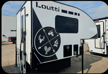
BBI LOUETTI 2025 # inventaire : BC25011