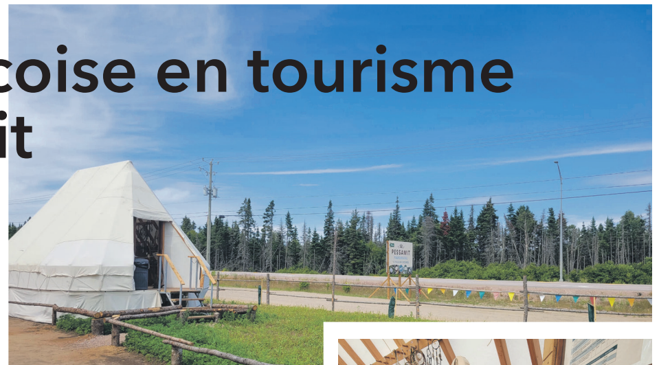
Le bureau d'accueil de Tourisme Pessamit, point de départ des visites guidées et des rencontres culturelles avec les guides innus.

De plus, le projet prévoit un tronc commun en tourisme qui pourrait être offert d'une communauté à l'autre, mais adapté aux réalités locales. « Chaque communauté viendrait enseigner ses