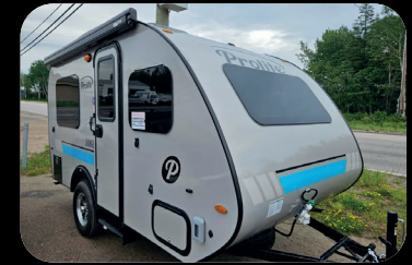
Prolite Lounge 2025 # inventaire : BC25002