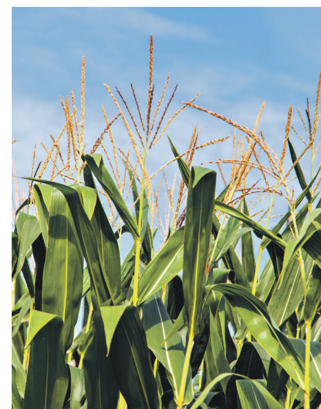
Une nouveauté à la ferme depuis deux ans, la culture de maïs destiné aux bêtes.