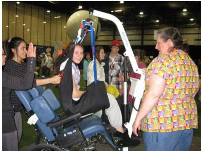
Des manipulations qui piquent la curiosité!