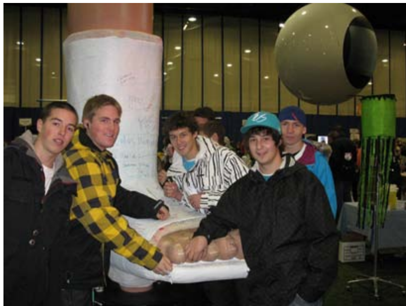
Des jeunes allumés!