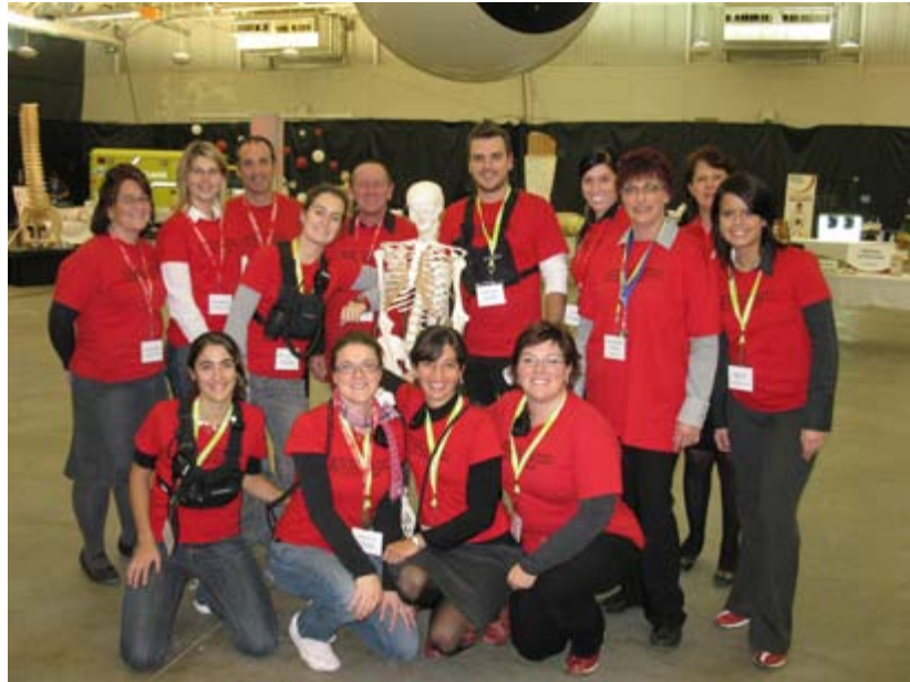
Une équipe d'organisation exceptionnelle

En octobre et novembre prochain, en Mauricie comme au Centre-du-Québec, c'est un événement à ne pas manquer!!!