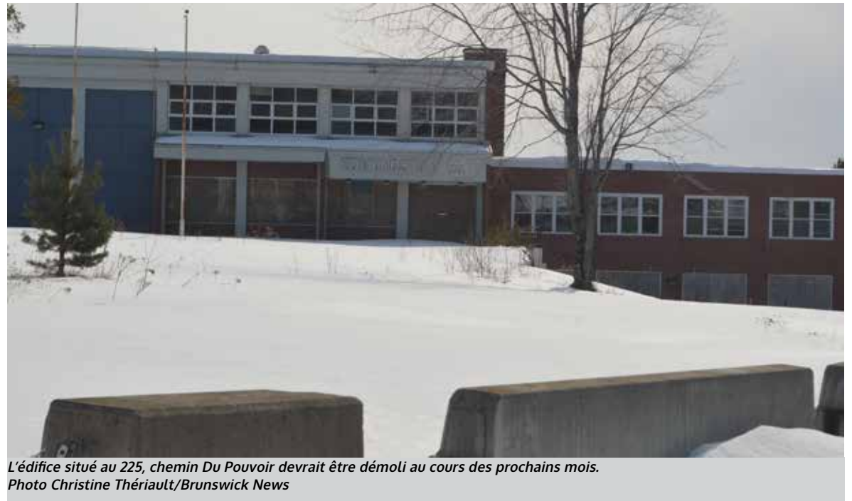
L'édifice situé au 225, chemin Du Pouvoir devrait être démoli au cours des prochains mois.

Depuis ce temps, le directeur général de la Ville d'Edmundston confirme que l'édifice continue de se détériorer et que des gens osent toujours s'aventurer à l'intérieur.