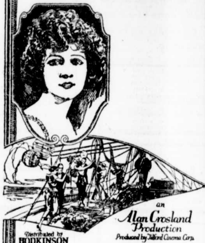
La ravissante Betty Compson, qu'on pourra admirer au Gaïeté, mercredi et jeudi dans son chef-d'oeuvre: "Amour du Sud à Miami" production d'une grande richesse. La vue est tout remarquable par les attractions sportives dont elle est remplie.