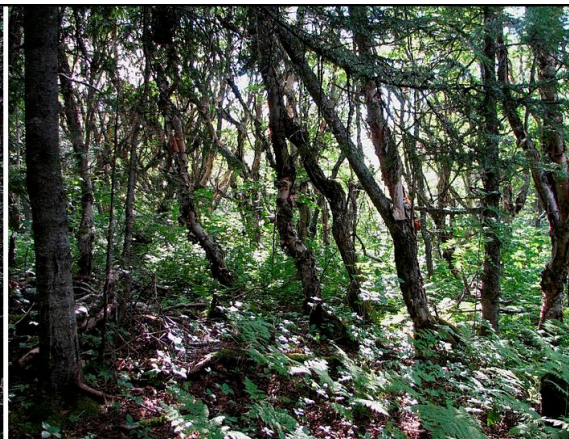
LE SENTIER DE LA FALAISE