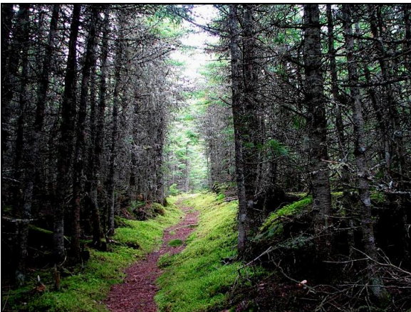
LE CHEMIN DE LA TRAVERSE

l'île, une sapinière dense. La lumière à l'intérieur de ce peuplement est limitée. La sapinière se prolonge jusqu'au côté nord de l'île où l'humidité des lieux est telle qu'une mousse verte tapisse le sol et les débris de végétaux. C'est un ravissement pour les yeux. Dans la falaise, les sapins baumiers et les épinettes blanches sont rabougris. Du côté nord-ouest, les troncs et les branches des bouleaux à papier sont tordus par les vents du large et donnent l'impression que la forêt est fréquentée par des lutins. Du côté ouest, un pré fleuri couvert d'épilobes, de verges