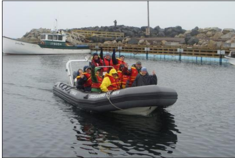
L'ARRIVÉE AU PORT DE GROSSE-ÎLE

Notre capitaine diminue la vitesse, les phoques se jettent à l'eau et s'approchent de nous.