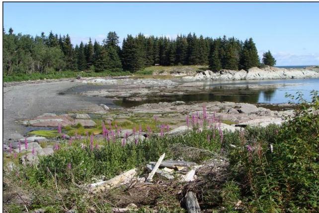
LA POINTE EST

Un séjour à l'île aux Basques est une expérience en soi. Tout en n'étant qu'à 5 km de la côte, en face de Trois-Pistoles, on s'y retrouve isolé de la civilisation. Pendant quelques jours, vivre sans voiture, télévision, radio, journaux, nous fait réaliser à quel point le confort et les commodités prennent de la place dans notre quotidien. Ce vide est toutefois amplement comblé par la beauté des lieux. Malgré ses dimensions modestes de 2 km de long par 0,5 km de large, l'île recèle différents habitats. On trouve, au centre de