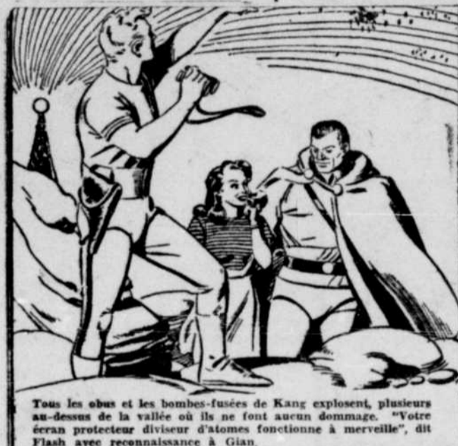
Tous les obus et les bombes-fusées de Kang explosent, plusieurs au-dessus de la vallée où ils ne font aucun dommage. "Votre écran protecteur diviseur d'atomes fonctionne à merveille", dit Flash avec reconnaissance à Gian.