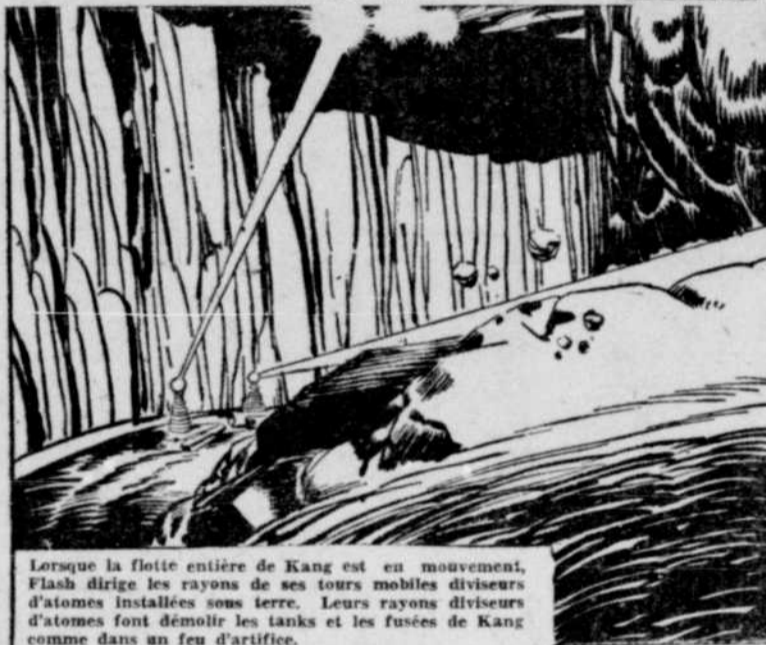
Lorsque la flotte entière de Kang est en mouvement, Flash dirige les rayons de ses tours mobiles diviseurs d'atomes installées sous terre. Leurs rayons diviseurs d'atomes font démolir les tanks et les fusées de Kang comme dans un feu d'artifice.