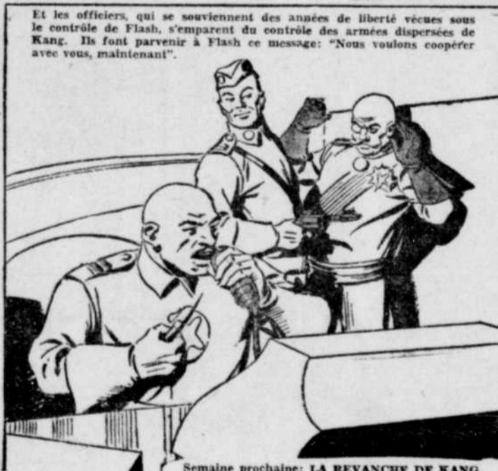
Et les officiers, qui se souviennent des années de liberté vécues sous le contrôle de Flash, s'emparent du contrôle des armées dispersées de Kang. Ils font parvenir à Flash ce message: "Nous voulons coopérer avec vous, maintenant".