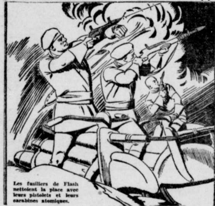
Les fusiliers de Flash nettoient la place avec leurs pistolets et leurs carabines atomiques.