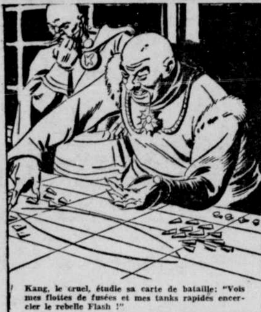
Kang, le cruel, étudie sa carte de bataille: "Vois mes flottes de fusées et mes tanks rapides encercler le rebelle Flash!"