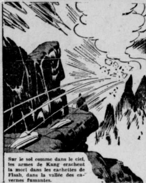
Sur le sol comme dans le ciel, les armes de Kang crachent la mort dans les cachettes de Flash, dans la vallée des cavernes fumantes.