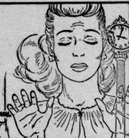
Paulette marche en dormant et se rend sur le toit d'une maison à appartements.