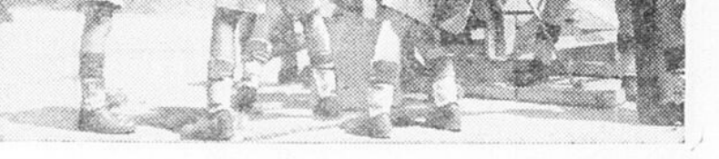
Photo prise du groupe des Fusiliers de la marine royale de la division de l'instruction à l'organisation de la défense mobile des bases navales, à Chatham, Colombo. La gravure représente: les fusiliers marins s'entraînant au chargement d'un canon d'exercice.