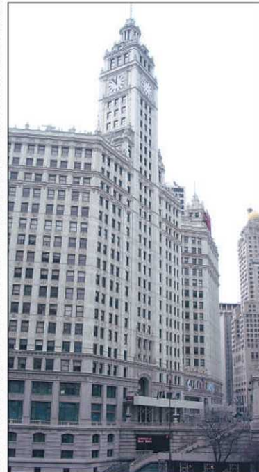
Le Wrigley Building est une impressionnante tour de terre cuite blanche.