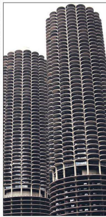
Surnommées les «épis de maïs» (corn cobs), les Marina Towers abritent des appartements aux étages supérieurs et 18 étages de stationnement.