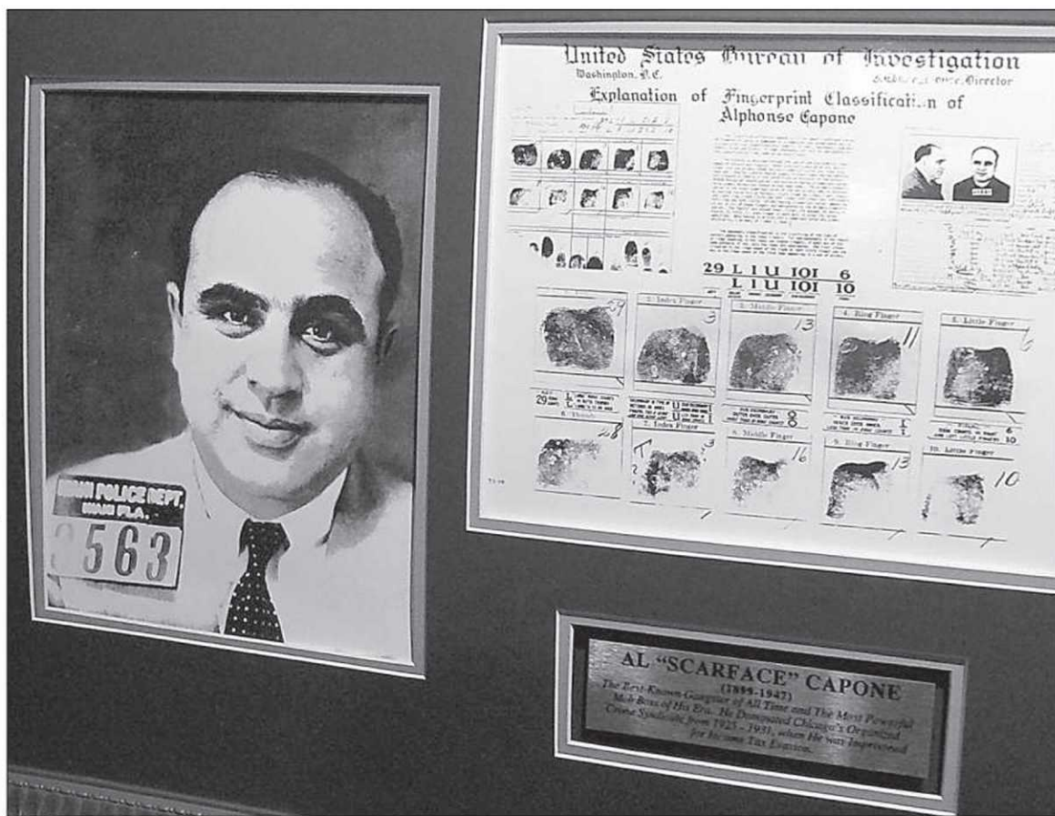
Le célèbre Al Capone aurait eu une chambre privée, un blanchisseur et un coiffeur à Moose Jaw.

Dès lors, une campagne de financement s'est mise en branle, on a reconstruit les passages