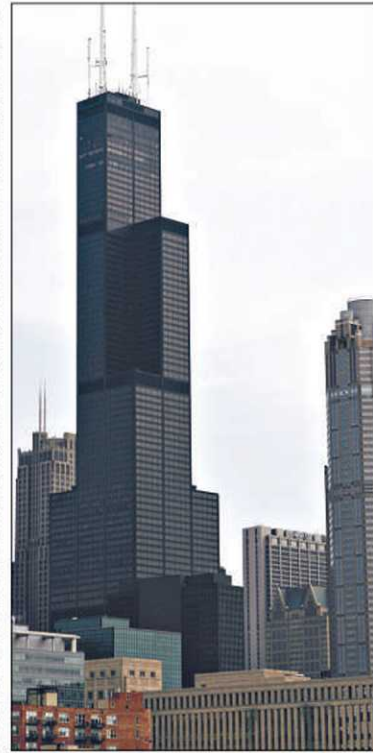
Avec ses 110 étages, la tour Sears domine la ville.