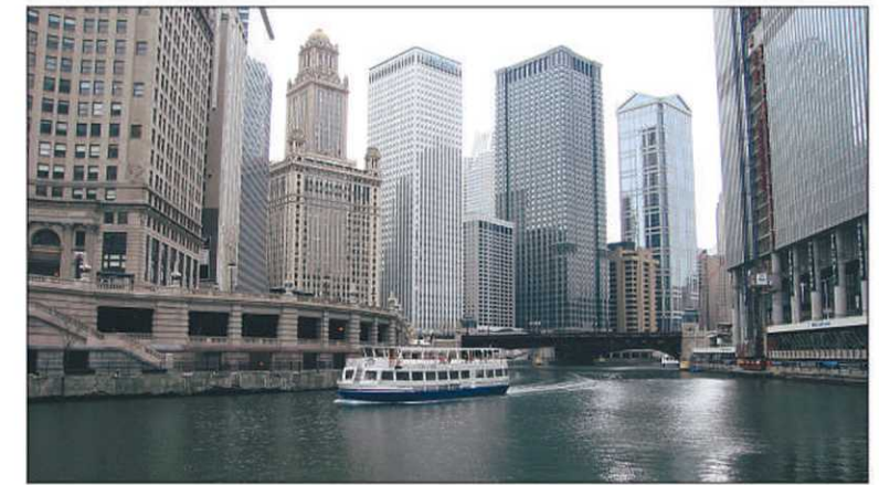
Une excursion en bateau sur la rivière Chicago offre une perspective particulièrement intéressante sur ses gratte-ciel.