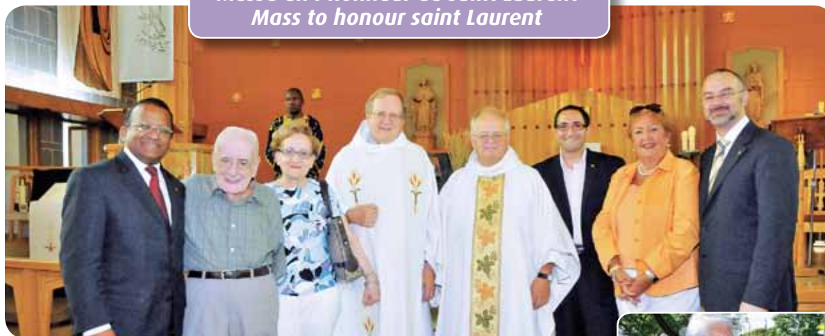
Messe en l'honneur de saint Laurent Mass to honour saint Laurent