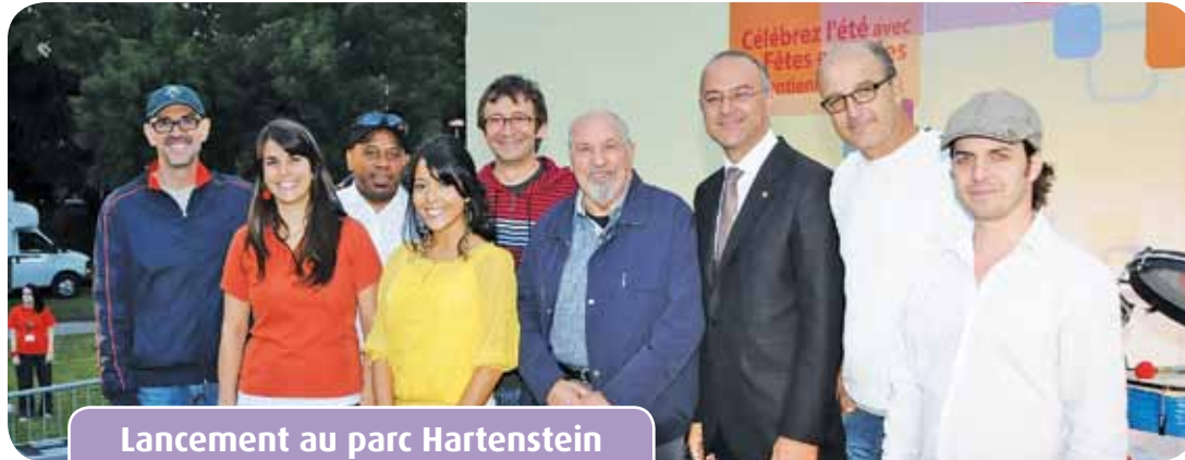
Lancement au parc Hartenstein Launch at Parc Hartenstein

CONT'D FROM PAGE 1 SUMMER CELEBRATIONS UNDER A SHINING SUN