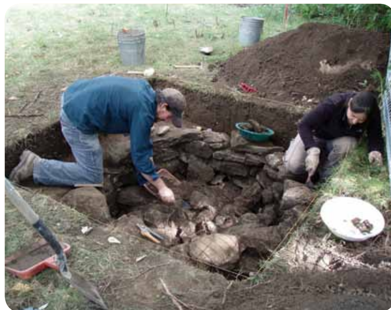
Les fouilles archéologiques effectuées à la maison Robert-Bélanger ont déjà permis d'inventorier plusieurs éléments du site original.